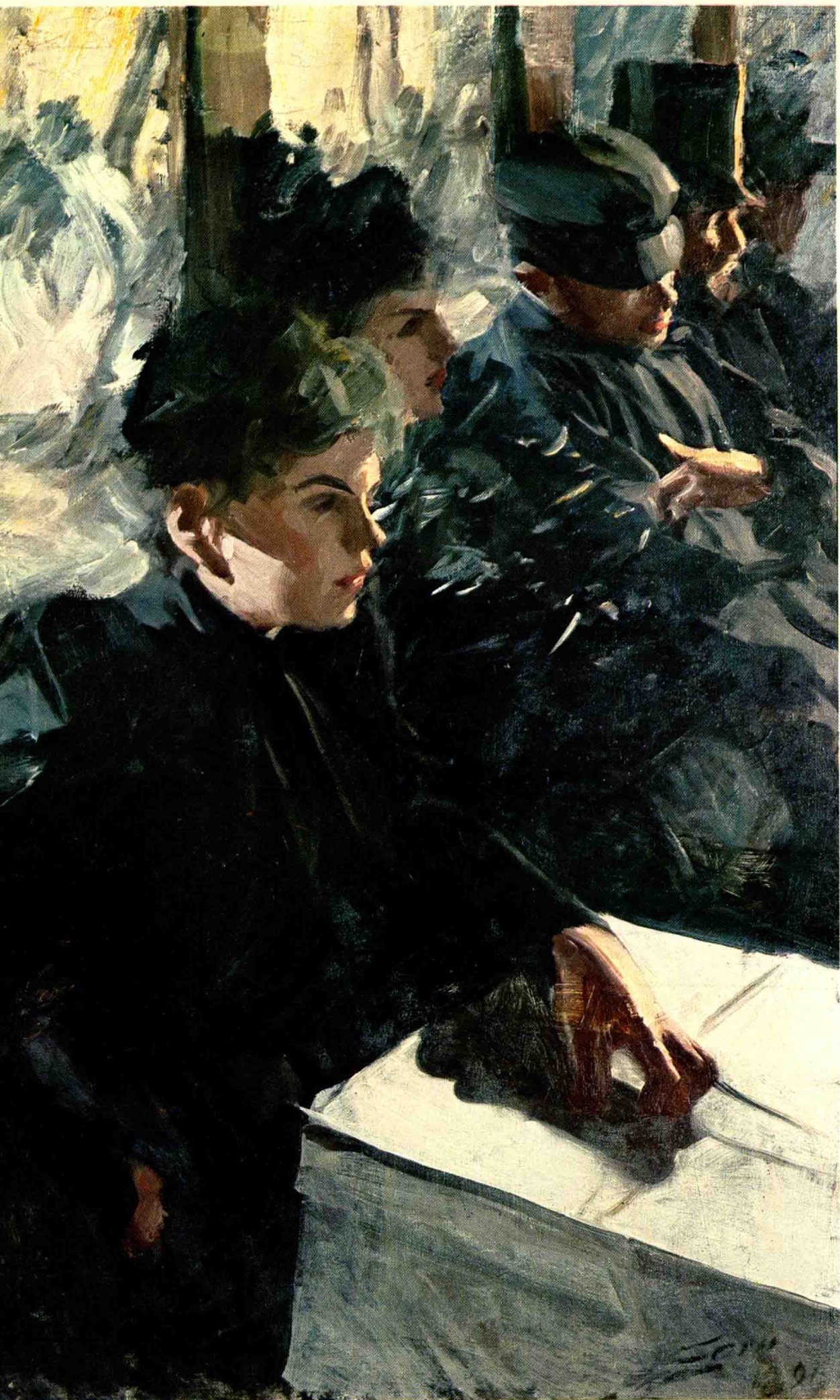
公共马车 1 号 (1891 年)