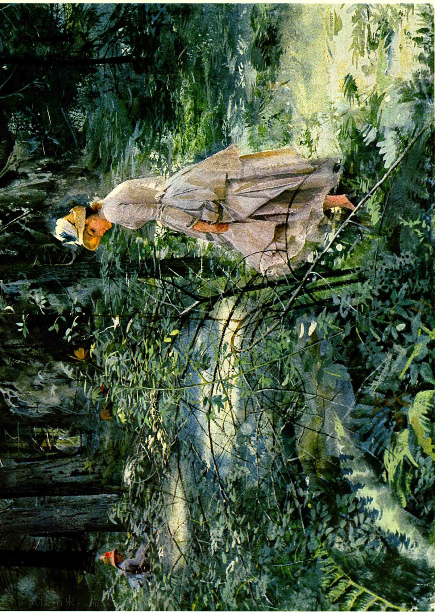
在丛林里(1886年) 水彩画