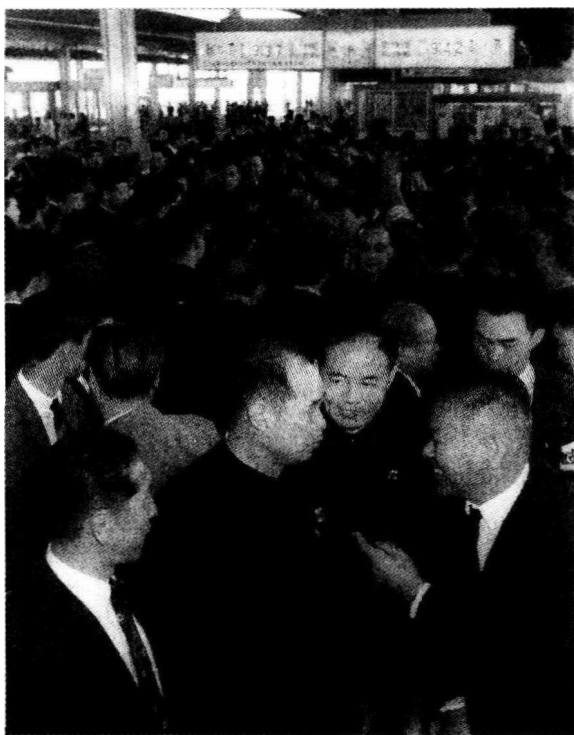
1971年3月25日，参加第31届世界乒乓球锦标赛的中国运动员抵达名古屋，日本乒乓球协会会长后藤钾二在车站迎接

欢迎仪式上，曾专程到北京邀请中国队参加本届世界比赛的日本乒协会长后藤钾二情绪非常激动。他致辞时，声音带着难以抑制的颤抖：“欢迎中国队相隔六年之后重返世界乒坛。中国队来到这里了，这是在日本实现的，是在日本实现的！……”