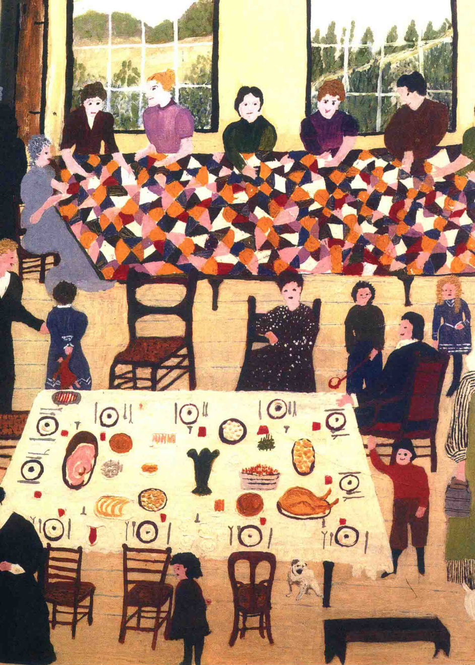
《大家缝活动》，1950年，木板油画（50.8×60.9cm）

“大家缝活动”是摩西奶奶的家乡比较流行的社交活动，它给人们提供了社交的机会，同时也有实用意义。