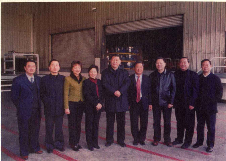
嘉兴市嘉善县领导陪同中共浙江省委书记习近平在晋亿公司视察时与蔡永龙和夫人蔡林玉华女士等合影