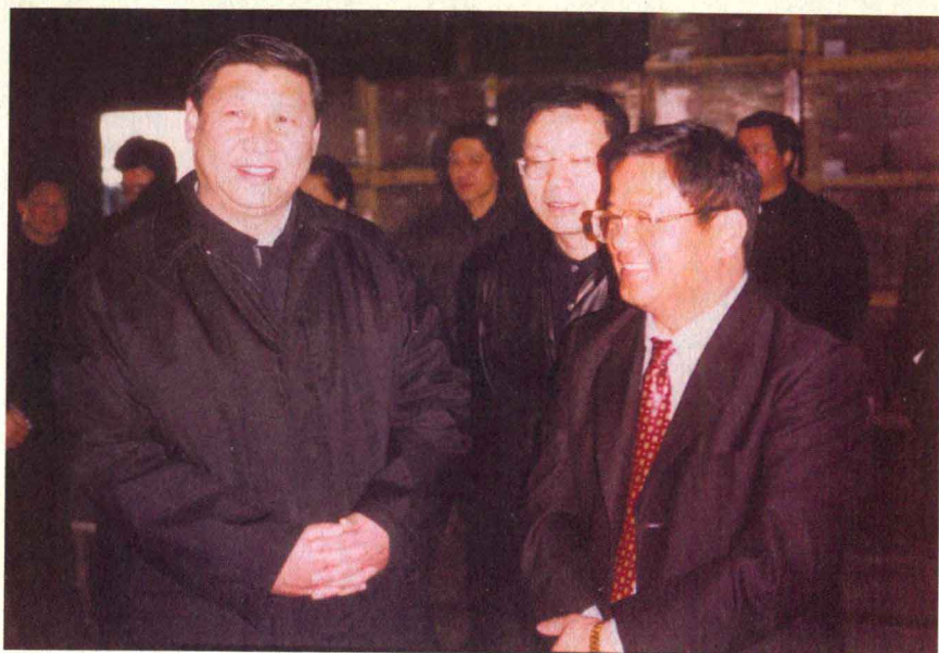
中共浙江省委习近平书记来公司视察