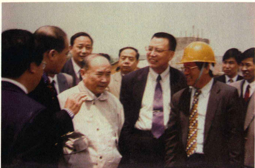
原浙江省委书记李泽民视察晋亿公司