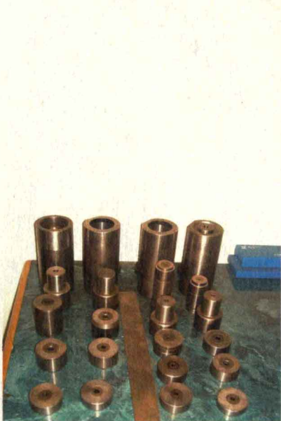
陈列在欧副总经理办公室的模具