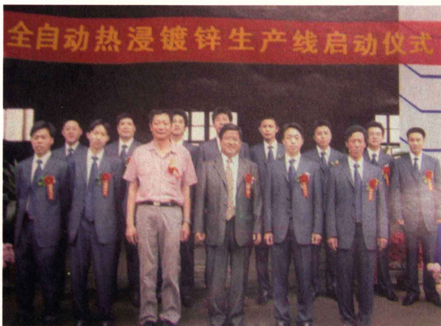
全自动热浸镀锌生产线启动仪式