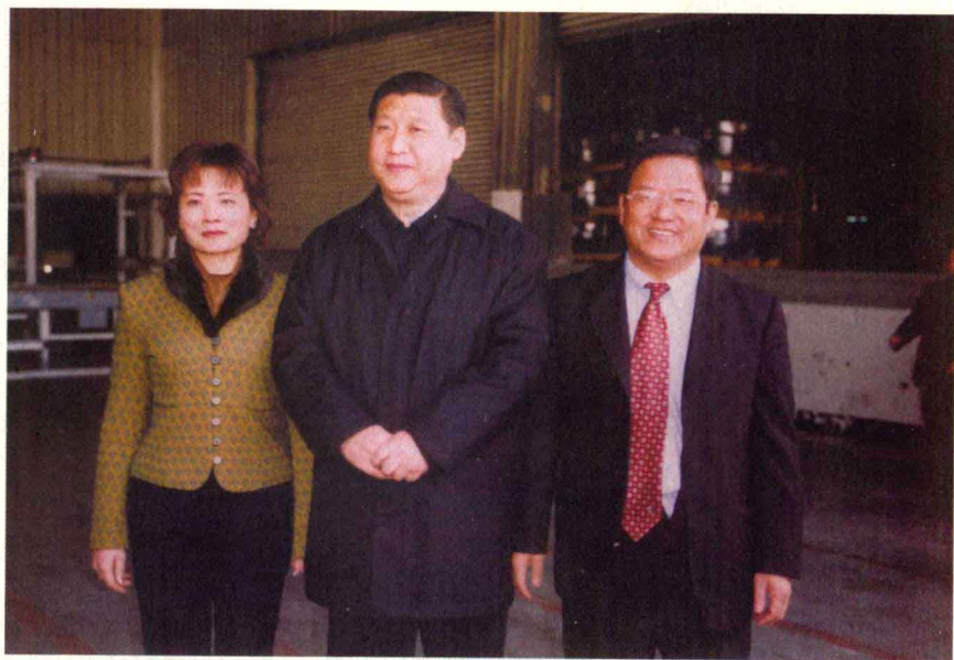
习近平书记与蔡永龙先生和夫人蔡林玉华女士合影