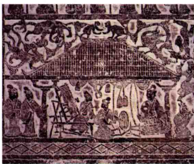
●汉 纺织画像石拓片(1956年江苏徐州铜山县洪楼村出土)