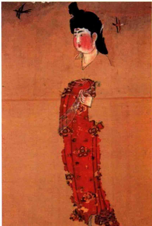
● 唐 花笼裙

女子穿花笼裙，走起路来的时候，看上去花鸟图案跟着摆动，就像是活了一样，更能衬托出女子的婀娜多姿。