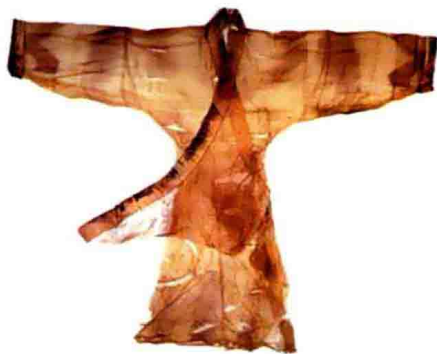
●素纱禅衣（湖南省博物馆藏）

国家文物局曾开展科研项目，复制这件总重49克的直裾素纱禅衣。受委托复制素纱禅衣的南京云锦研究所复制出来的第一件素纱禅衣的重量超过80克。后来，专家共同研究才找到答案，原来蚕宝宝比几千年前的要肥胖许多，吐出来的丝明显要粗、重，所以织成的衣物重量也就重多了。紧接着专家们着手研究一种特殊的食料喂养蚕，控制蚕宝宝的个头，再采用这些小巧苗条的蚕宝宝吐出的丝复制素纱禅衣，最终织成了一件49.5克的仿真素纱禅衣，这一研究竟耗费专家们13年的心血。