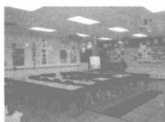
(English classroom) (American classroom)

学生回答后,教师可以让学生在小组内讨论中、英、美三国的小学教室有什么相同的地方和不同的地方,并让小组代表进行汇报。