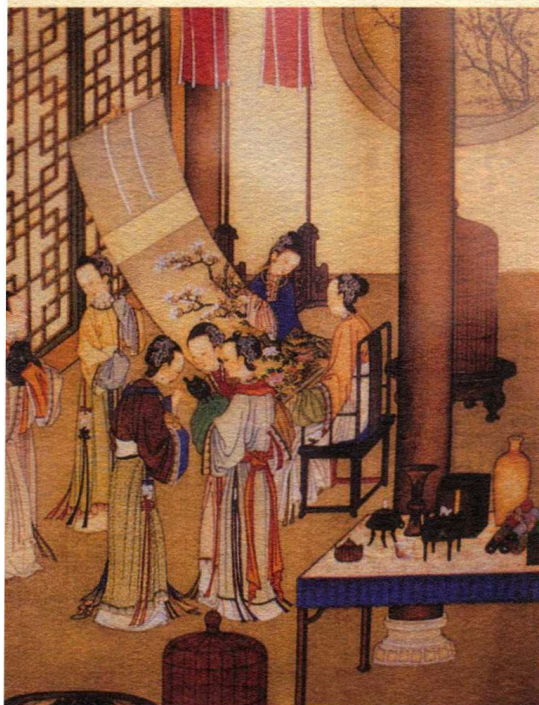
《月曼清游图册之七》 清·陈枚

仕女画是历代画家笔下的常见题材，画中的仕女们常与琴棋书画相伴，美丽而清雅，是文人画家们心目中的理想女子。