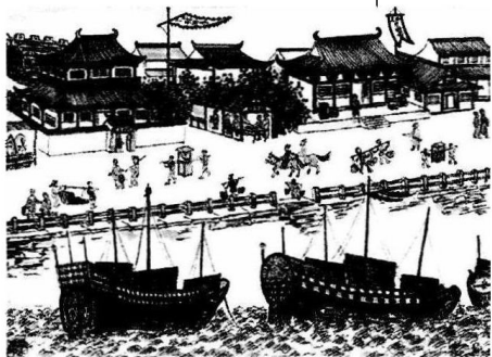
↓ 画家笔下的古镇海

周氏祖籍浙江镇海（现属宁波市辖区），古曰蛟川，与上海一衣带水，位于长江三角洲南翼，东屏舟山群岛，西连宁绍平原，南接北仑港，北濒杭州湾。镇海历史悠久绵长，据考证，早在新石器时代就有了人类居留的痕迹。宋朝时，仗借其“浙东门户”的优越地理位置，“海上丝绸之路”即以镇海为起碇港，成批的丝绸、瓷器、茶叶远销四方，换回不可计数的香料、黄金、奇珍异兽。一拨紧接一拨的镇海人依靠溯江航海的便利，漂洋渡海、经商求学，弄潮于世界舞台，声名赫赫的“宁波帮”因此催熟而出。惜古往今来，福无双至。正因占据险要的