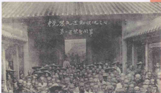
1924年9月10日，东莞县第一区农民协会在霄边（今长安镇霄边社区）成立。图为成立大会盛况。