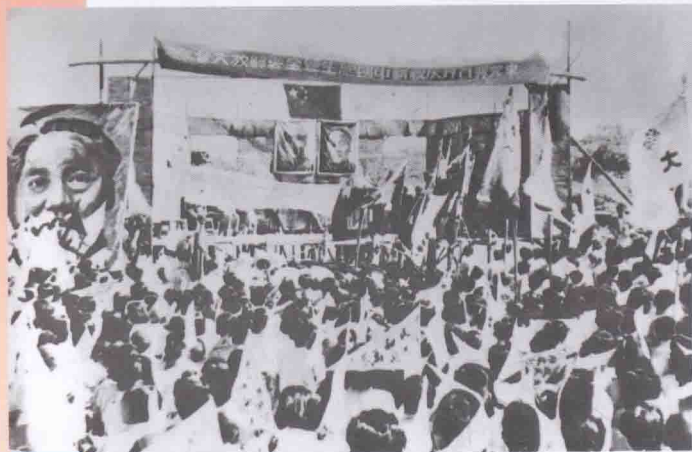
1949年11 月2日，東莞各 界人民群眾隆 重舉行慶祝新 中國誕生暨全 縣解放大會。