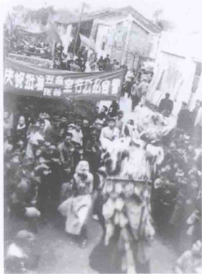
1956年1月，东莞开展对资本主义工商业、手工业的社会主义改造。图为庆祝批准五金、医药全行业公私合营大游行。