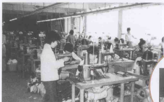
東莞縣 太平手袋廠 TAIPING HANDBAG FACTORY