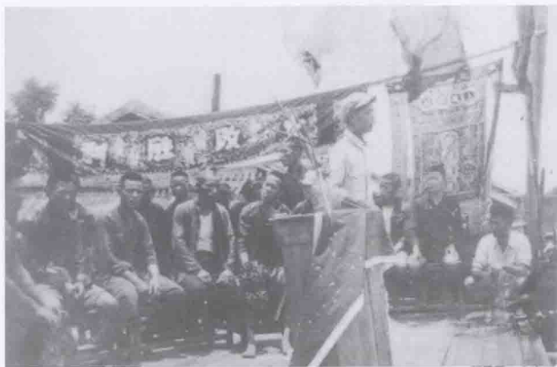
1950年11月至1953年4月，东莞开展土地改革运动，彻底消灭了延续两千多年的封建土地所有制，解放和发展了农村生产力。图为农民集会庆祝土改胜利、土地还家。