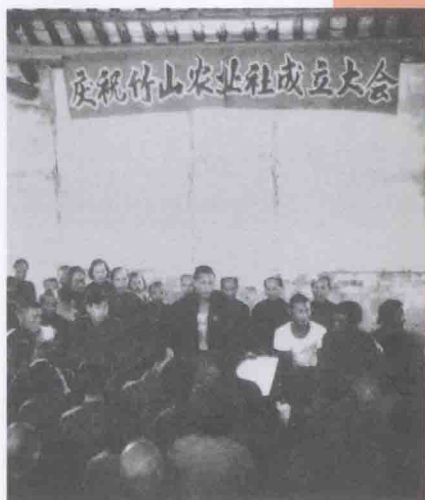
1954年2月23日，东莞第一个初级农业生产合作社——竹山农业社在东莞县第四区竹山乡（今大朗镇竹山社区）成立。