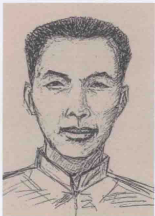
东莞中共组织和青年团组织的创始人莫萃华。