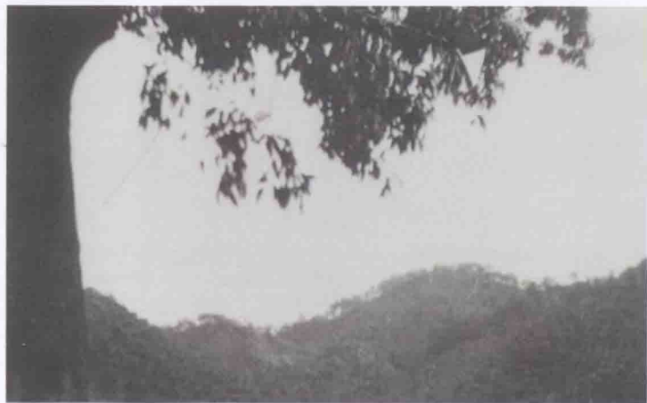
土地革命战争时期东宝工农革命军活动的地方——东莞大朗东山坳。