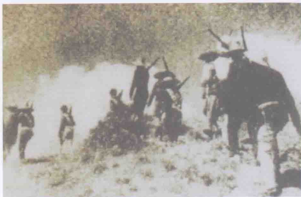
战斗在广九铁路两侧的广东人民抗日游击队东江纵队。