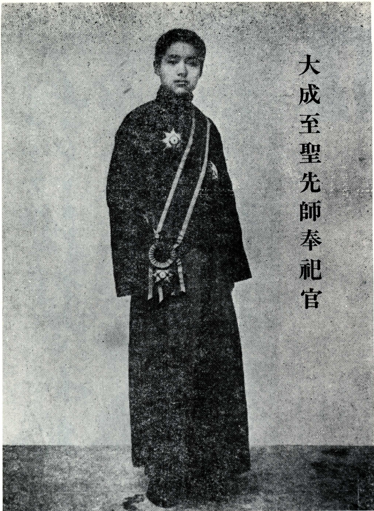
孔德成像 孔德成像 Kong DeCheng