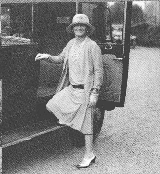
1928年，Chanel穿着一件宽松长袖的运动衫