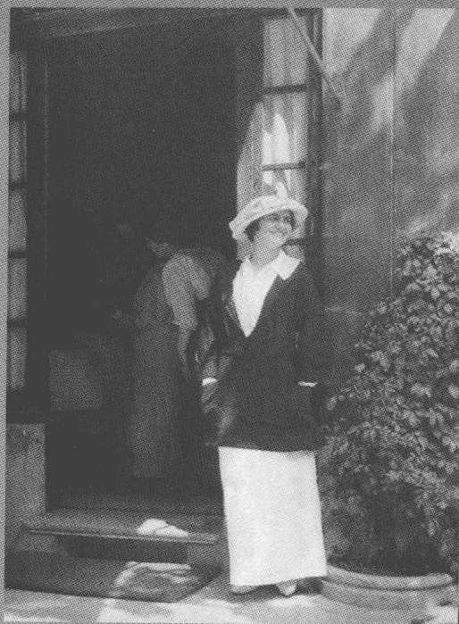
1913年,在 Deauville 的时装店前