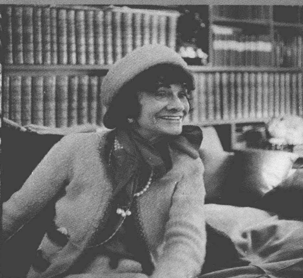
1964年,巴黎rue Cambon 31号的公寓