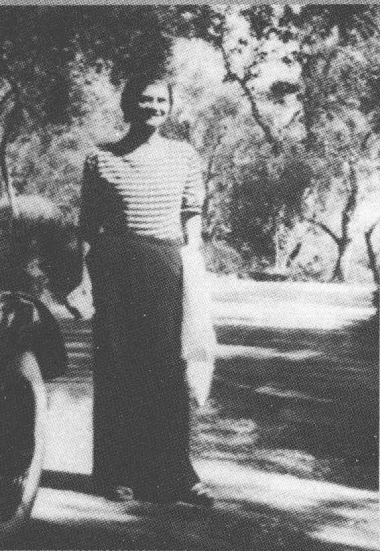
1930年，法国 riviera 的 房子“La Pausa”前