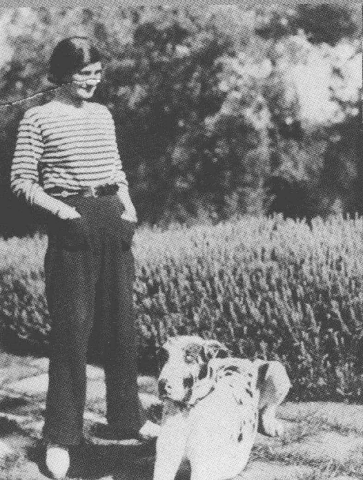
1930年，和爱犬Gigot在法国riviera的房子“La Pausa”前。