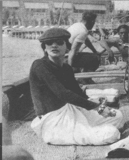
1936年，威尼斯附近的度假胜 地 Lido 岛，游船上