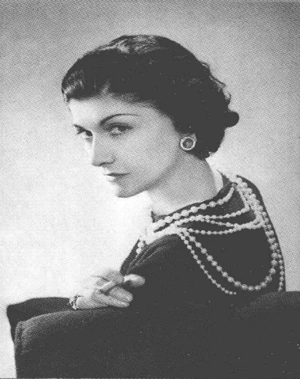
1936年，Chanel 著名的珍珠项链