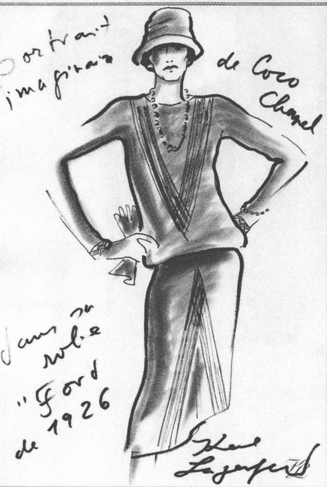
Coco 穿着 1926 年设计的“Ford”裙，作者就是大名鼎鼎的 Karl Lagerfeld。