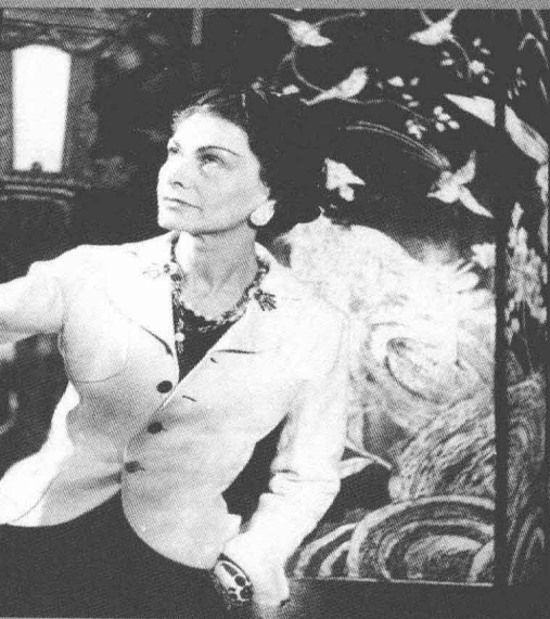
1937年,巴黎rue Cambon 31号寓所