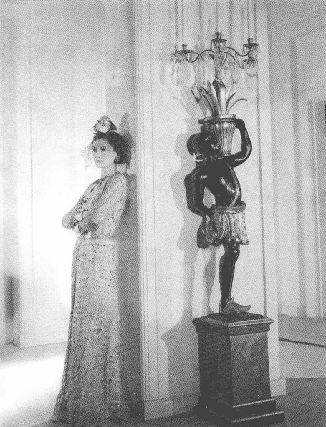
1937年摄影师 Cecil Beaton 为 Gabrielle Chanel 拍摄的照片，这张照片中 Coco 所穿着的裙子也被 Karl Lagerfeld 作为灵感，他在 1996 年春夏 CHANEL 高级定制秀中重新诠释了金色蕾丝刺绣和彩色金属亮片。