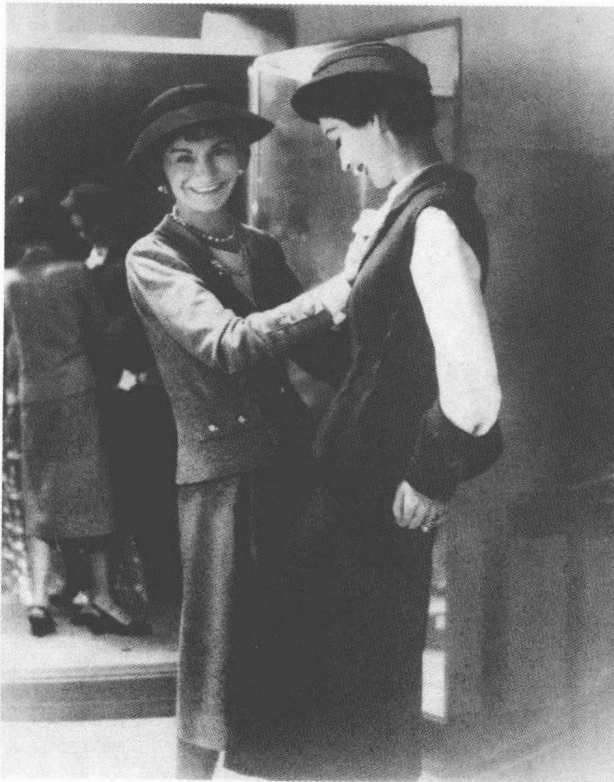
Chanel 和她的模特在工作中, 这是 Coco 于 1954 年推出的第一个系列。