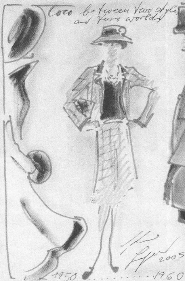
又一幅“Ford”裙素描画，作者还是 Karl Lagerfeld，于 1920 年。