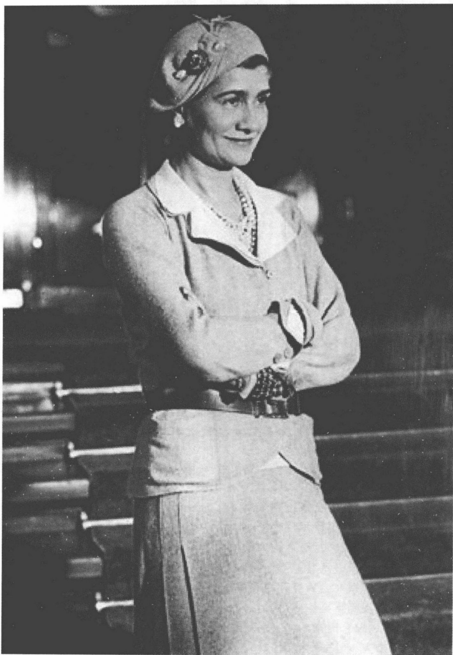
时 间: 约 1960 年