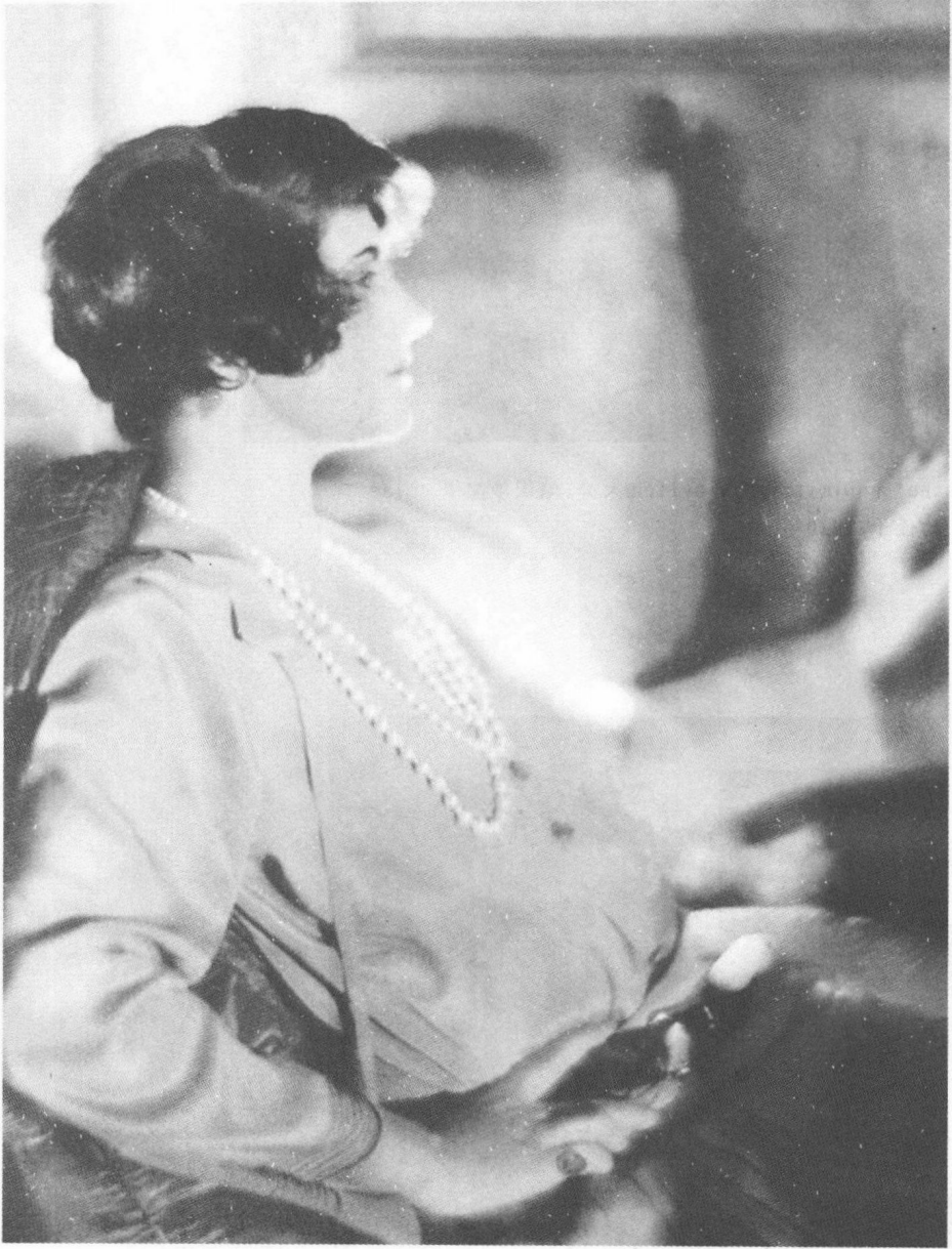
留着短发的 Gabrielle Chanel, 1920 年。