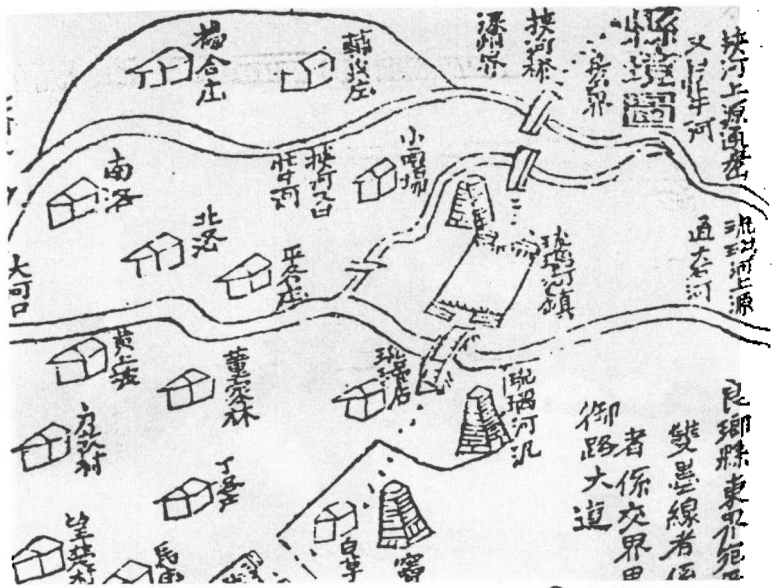
▲ 清光绪年间的琉璃河镇

秦统一天下后，房山辖区先后设置的侯国名称和隶属均变化频繁，而琉璃河地区一直归良乡县所辖。唐代，文献已明确记载了陶村等今属琉璃河地区的一些村名，在云居寺石经题记中记