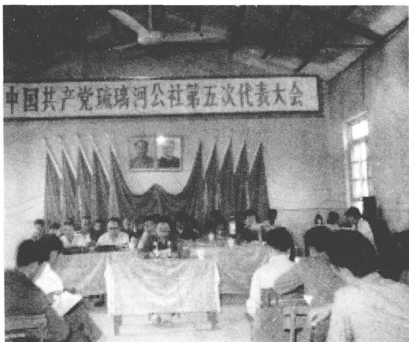
▲ 琉璃河公社党代会会场（1980年）

新中国成立初期，房山县、良乡县仍分设，县以下仍实行区、村制，琉璃河、窑上等地归良乡县的七区和八区所辖，琉璃河窑上包括的村有窑上、万里、韩家营（韩营）、陶村、琉璃河、祖村、路村、保兴庄、立教、南召、等驾林等。1954年，琉