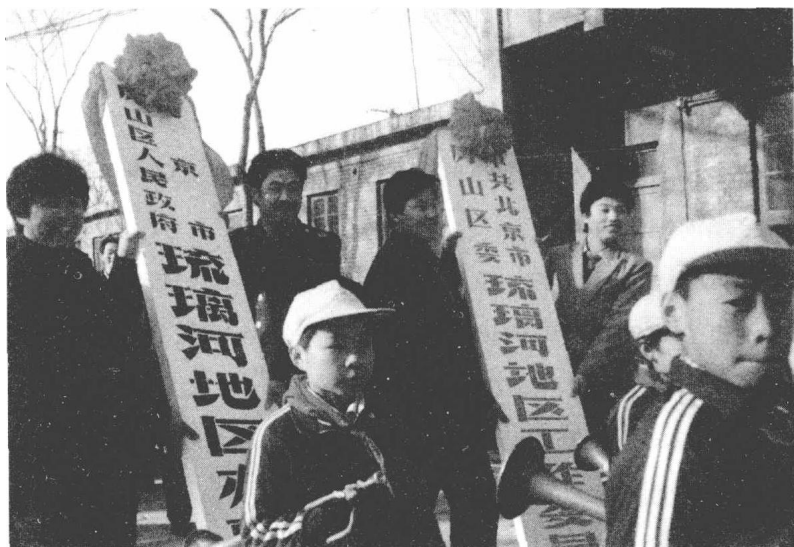
▲ 琉璃河地区办事处挂牌（1990年）

1981年初，在“改社建乡、政社分开”的农村体制改革下，琉璃河于1981年3月率先改公社为乡，建立了琉璃河乡党委、乡政府和农工商总公司。1983年，除琉璃河乡外，南召公社（东