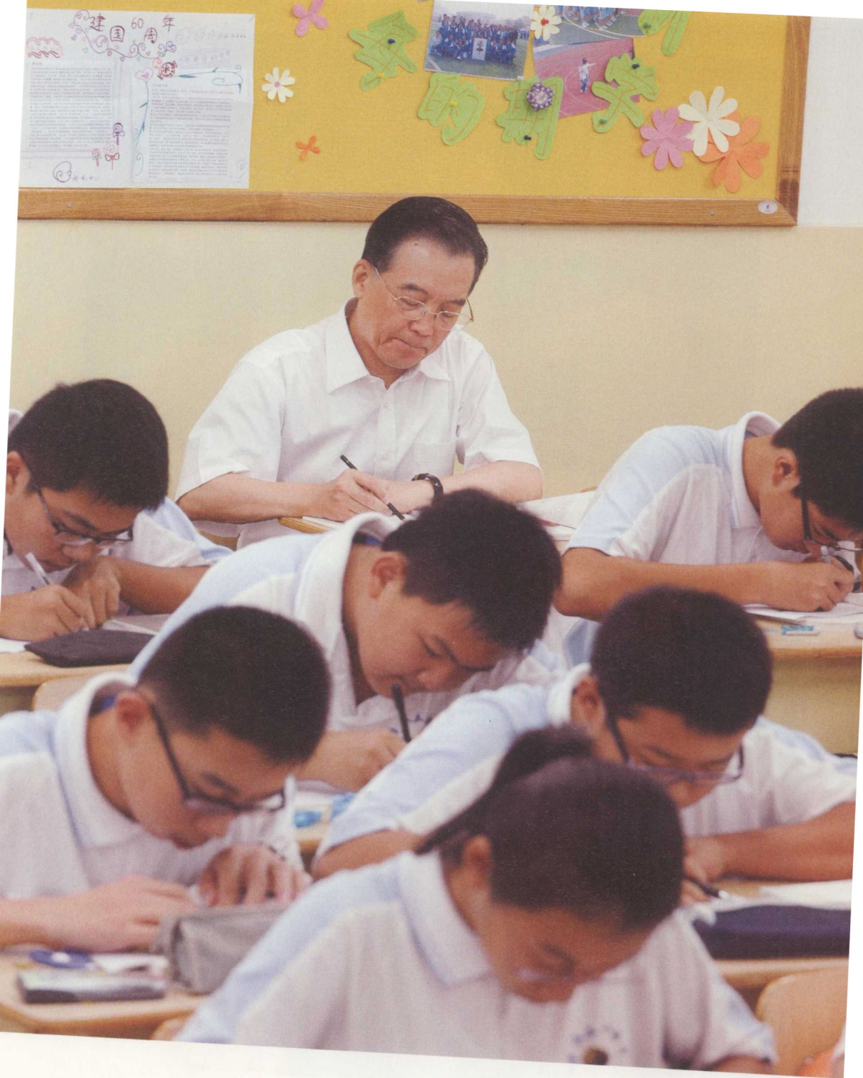
2009年9月4日,温家寶在北京市 第三十五中學初二(5)班聽課