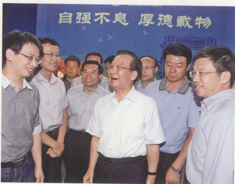
2012年9月14日,温家寶到清華大學看望師生