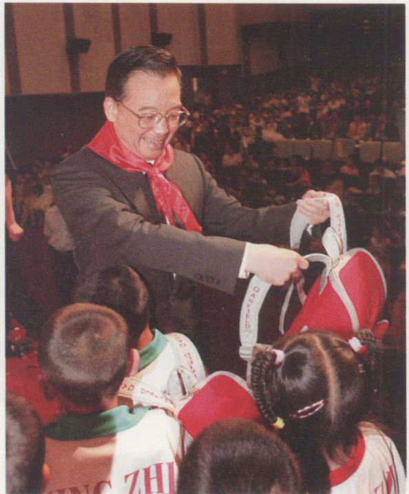
2004年5月29日,温家寶向北京市海淀區行知實驗學校的農民工子女贈送書包,並親手給他們背上肩