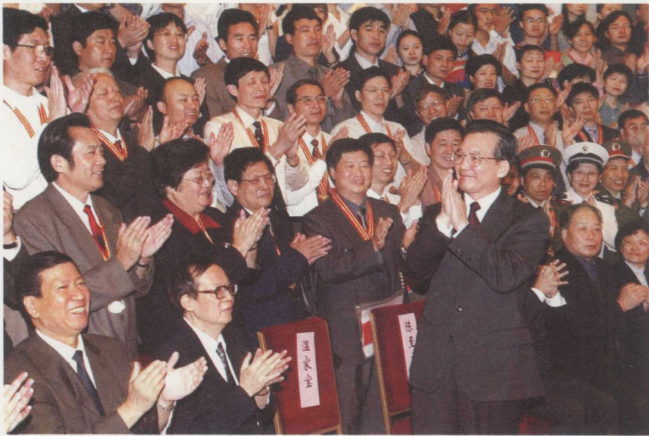
2003年9月9日,温家寶會見全國農村中小學優秀教師代表和第一屆高等學校教學名師獎獲得者