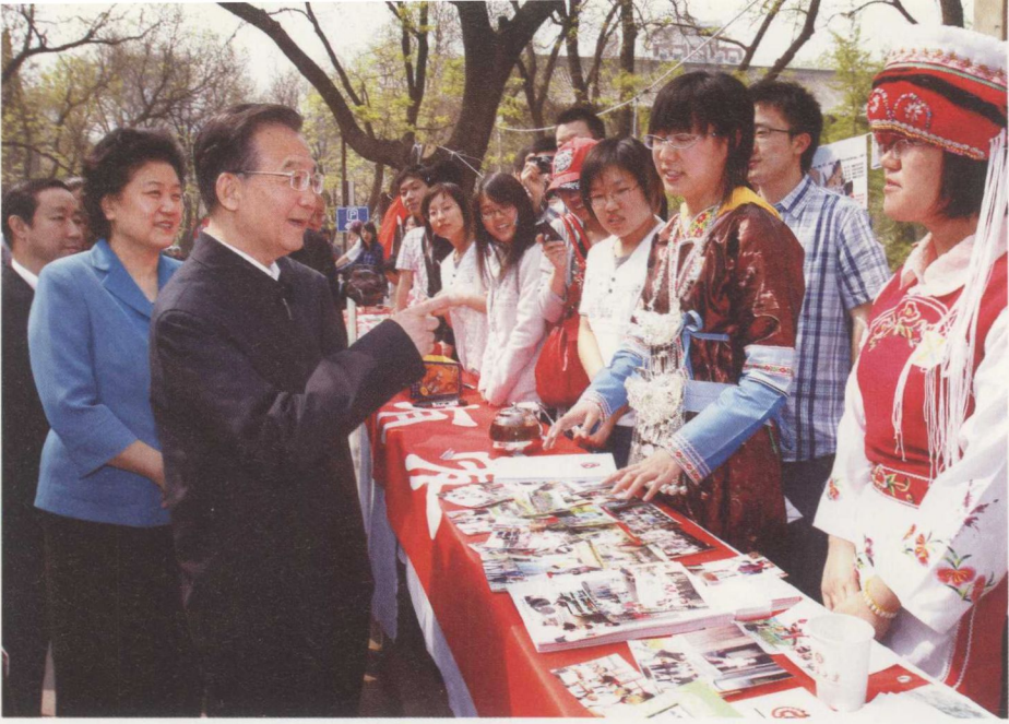
2010年5月4日,温家寶在北京大學五四大道 與學生交談