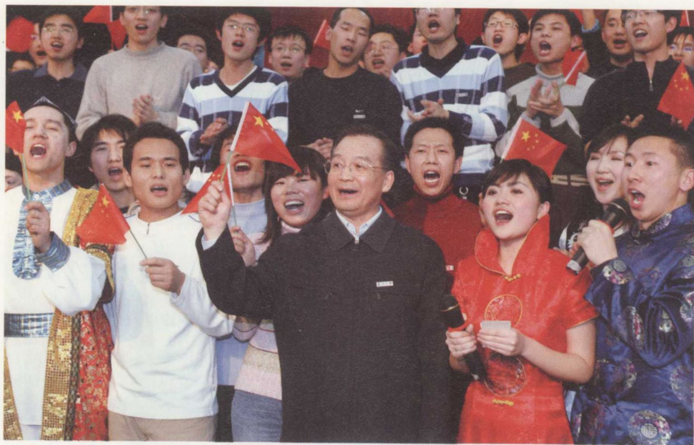
2007年2月17日,温家寶在東北大學學生活動中心與同學們一起高唱《歌唱祖國》