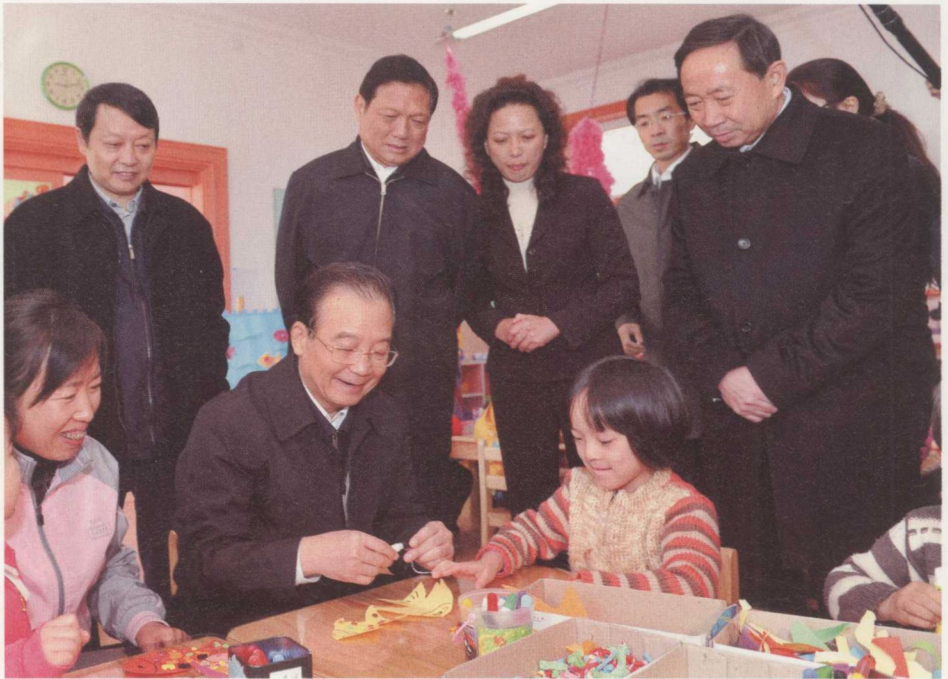
2010年11月2日,温家寶到北京市西城 區虎坊路幼兒園調研時,與孩子們一起 做手工