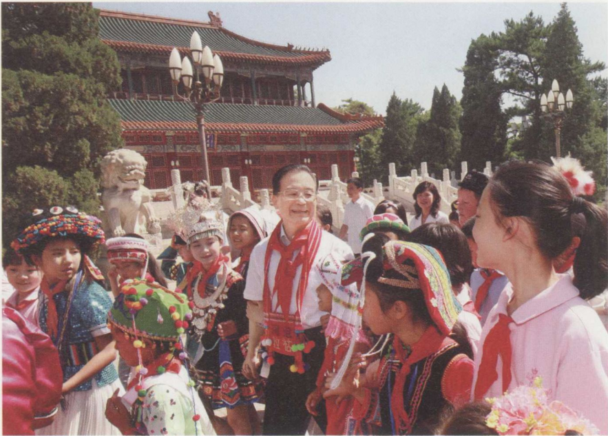
2009年6月1日,温家寶邀請孩子們參觀中南海