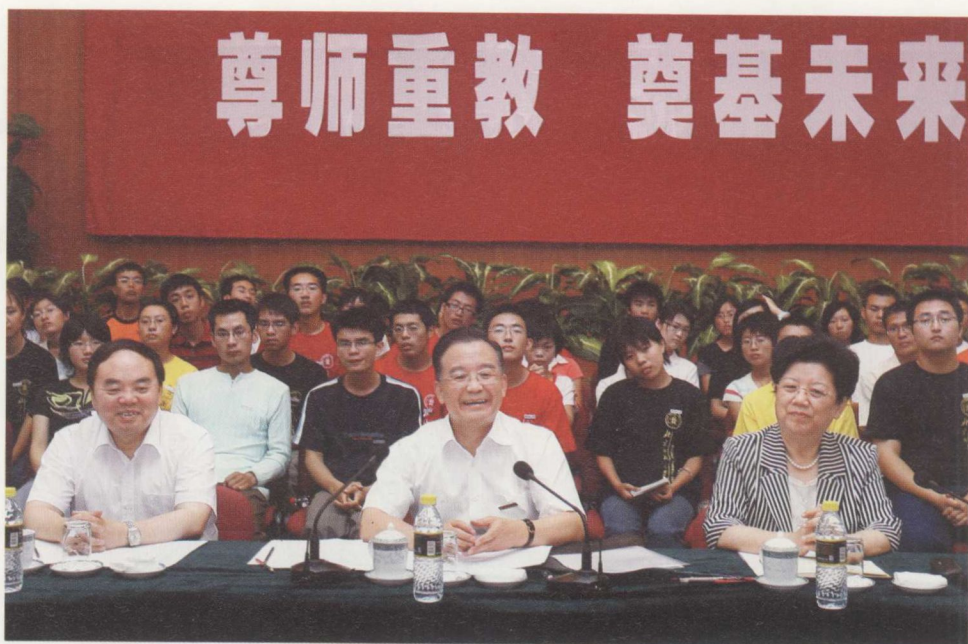
2007年9月9日,温家寶與北京師範大學免費師範生座談