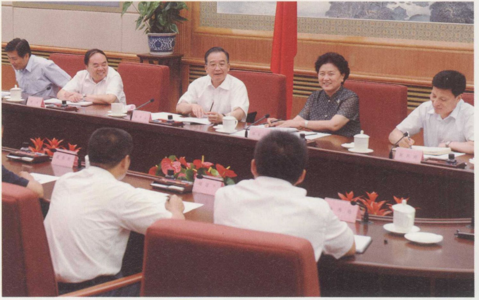
2008年9月9日,温家寶在中南海與來自基層的中小學教師座談