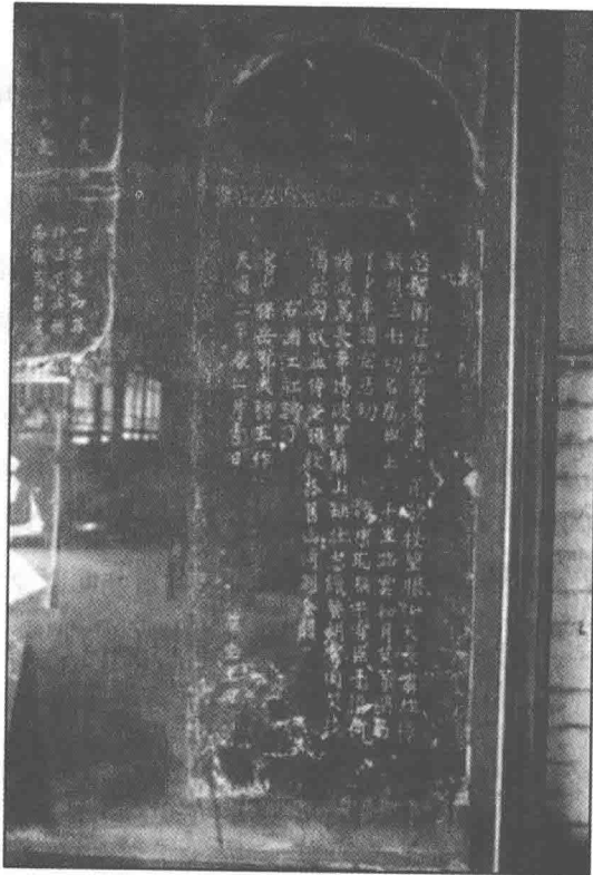
汤阴岳飞庙《满江红》词碑（词碑尾句作“朝金阙”，与流行的“朝天阙”一句稍异。）