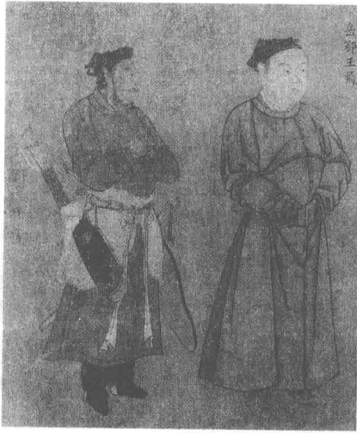
岳飞像，本书描写的兵飞形象即据此图。