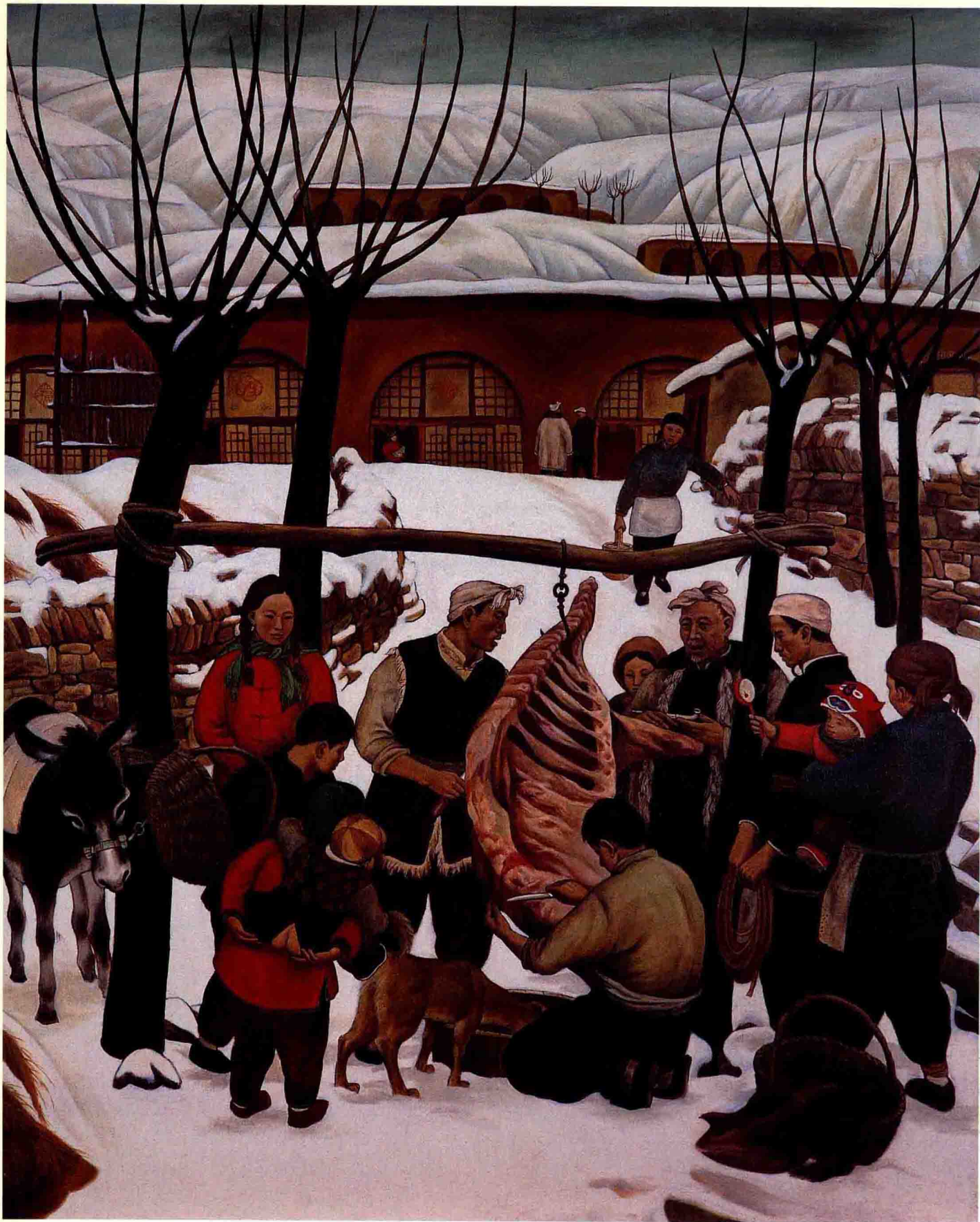
车长森（1951.12— ）《腊月》，布面油画，100 × 80cm，入选“全国群星美术作品展览”，入编《江苏美术 50 年》画册，1993 年作。