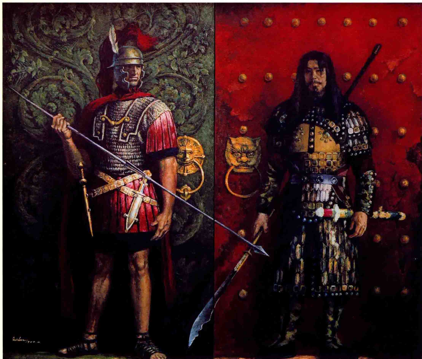
戚伟俊（1955.11— ）《纪元的复数》，布面油画，180 × 160cm，入编《今日中国美术》画册，并被新加坡画廊收藏，1999 年作。