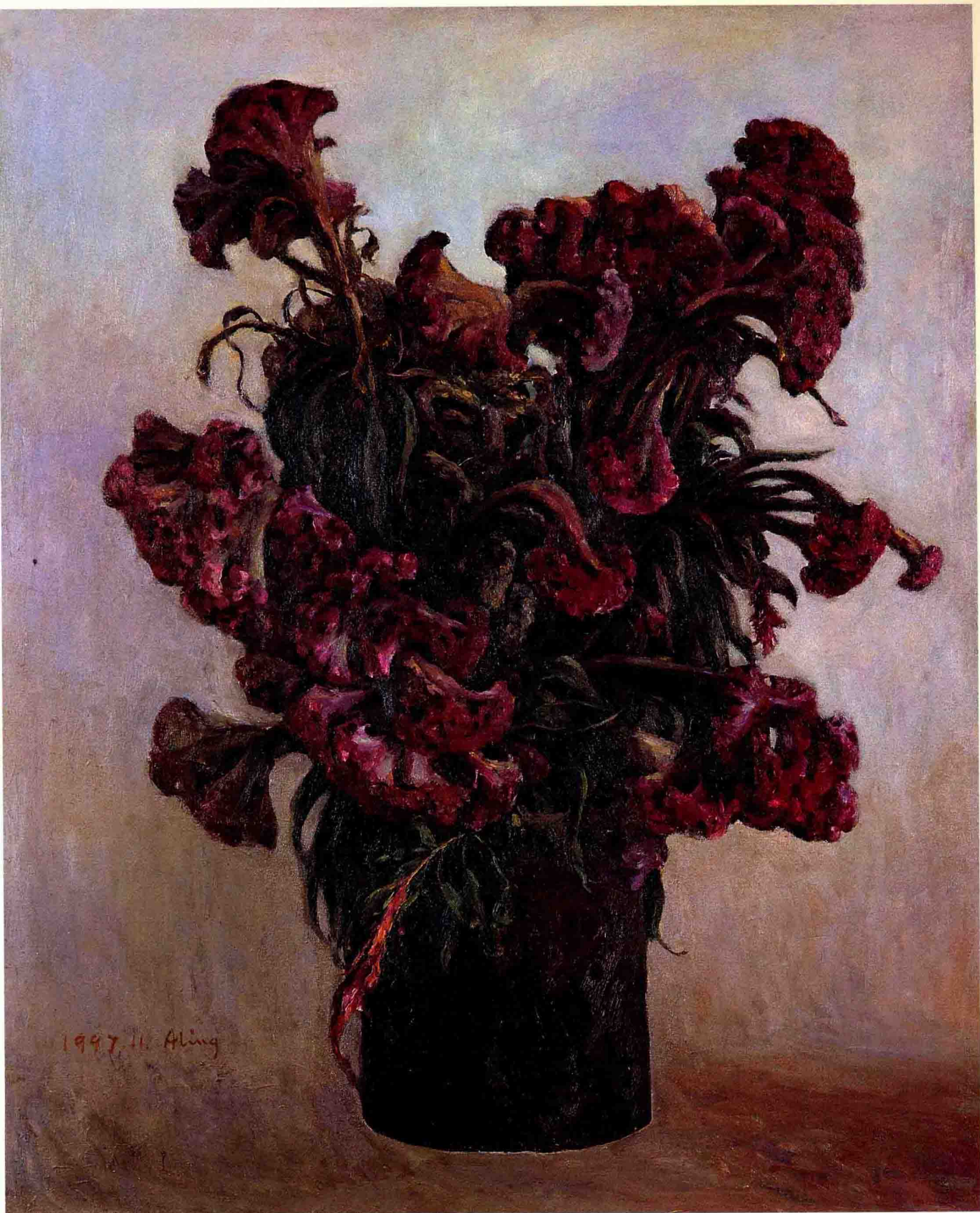
徐伟灵（1954.2— ） 《秋艳》，布面油画，55 × 46cm，入选“江苏省油画展览”，1997年作。