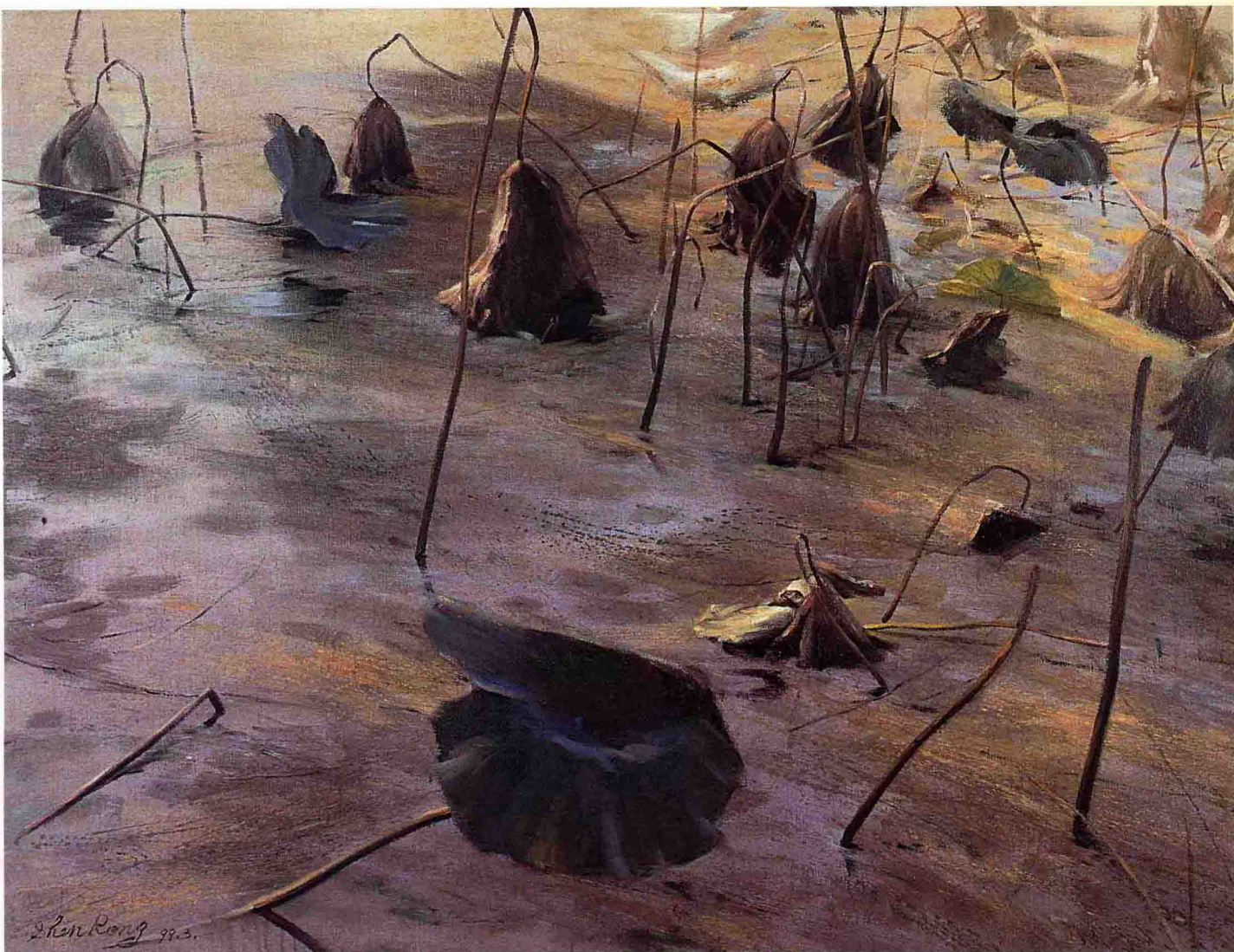
沈荣（1958.11—） 《秋水荷韵》，布面油画，145 × 112cm，入选“迎接新世纪江苏省油画大展”，1999年作。