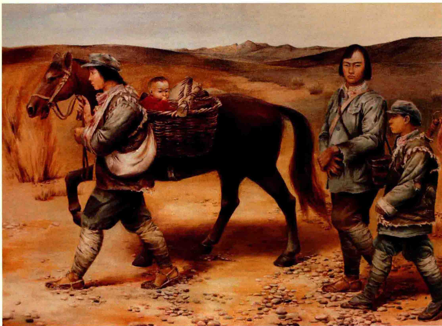
林超音（1959.2— ） 《途涉》，布面油画，120 × 80cm，入选“江苏省庆祝建党70周年美术作品展览”，1989年作。