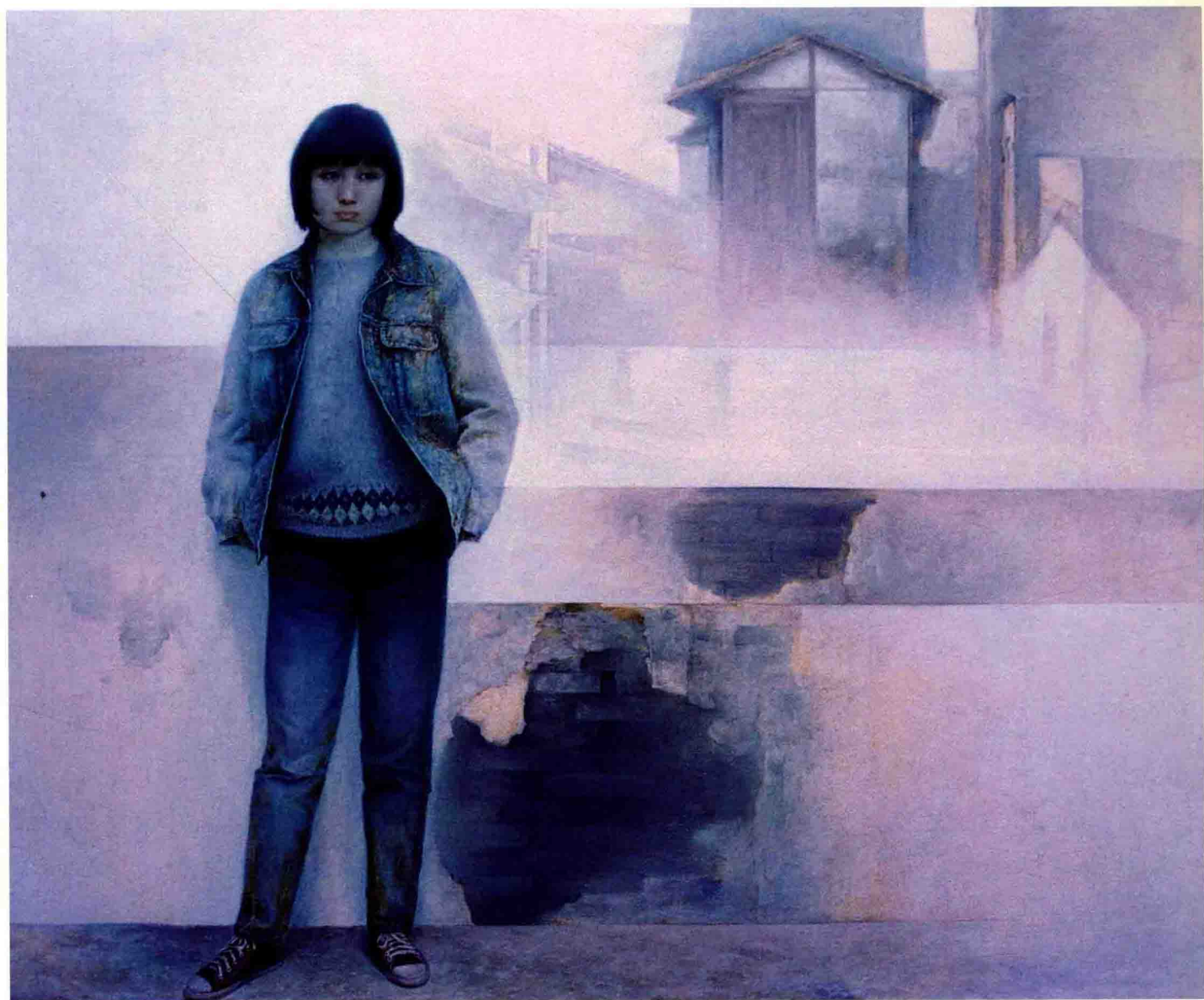
赵家兴（1959.6-- ） 《神伫》，布面油画，180 × 160cm，入选“全国第七届美术作品展览”，1989年作。