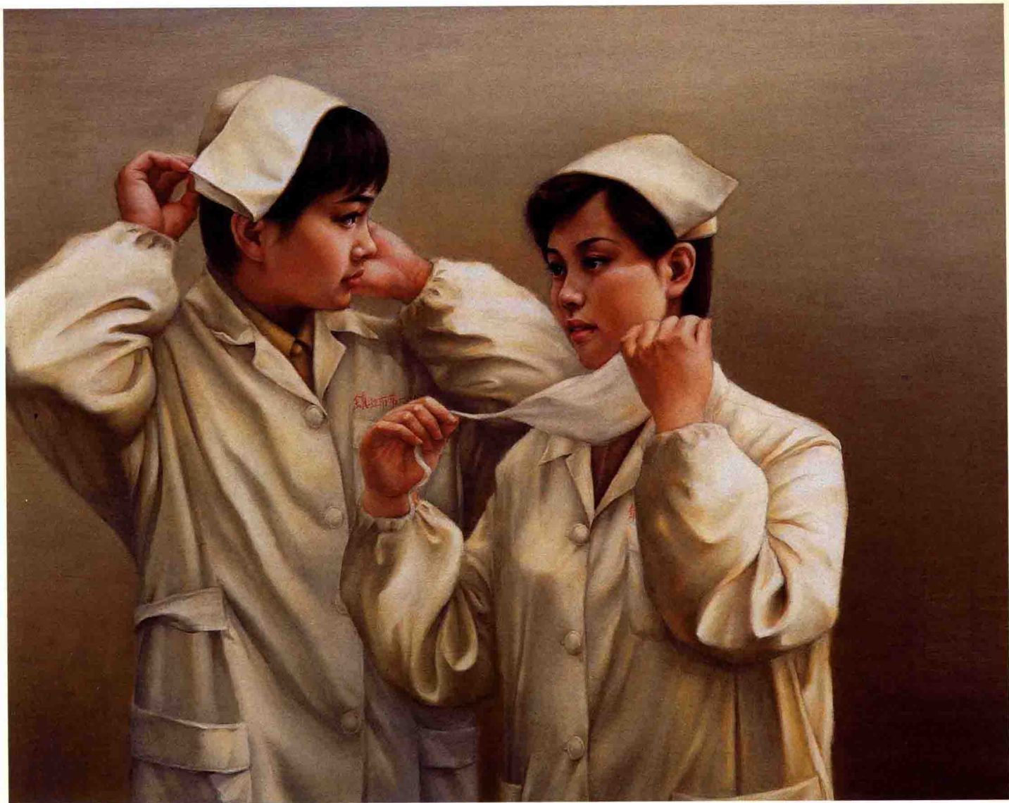
倪忠和（1949.10-- ） 《上班之前》，布面油画，130 × 100cm，入选“江苏省艺术节展览”，1998年作。