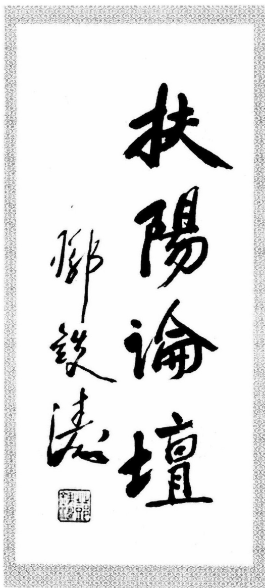
▲著名中医学大家、国医大师邓铁涛为扶阳论坛题词