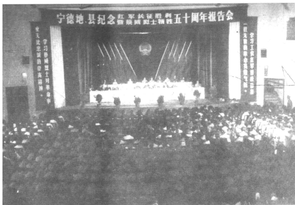
宁德地、县纪念红军长征胜利暨蔡威烈士牺牲50周年报告会