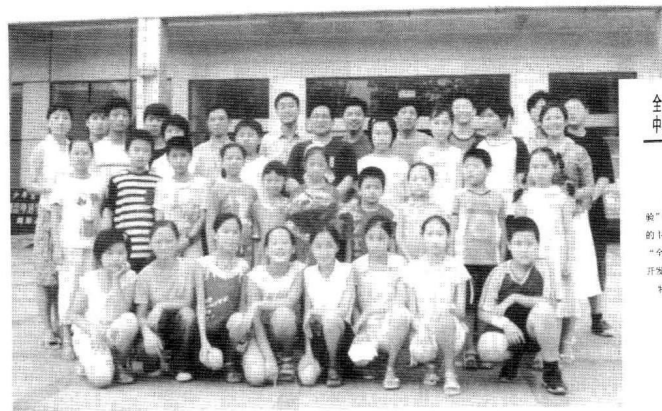
教育部和教育学会开具给作者全脑学习的科研证明。

全国教育科学“十五”规划课题全脑教育 中国教育学会“十五”科研课题全脑创新 总课题组