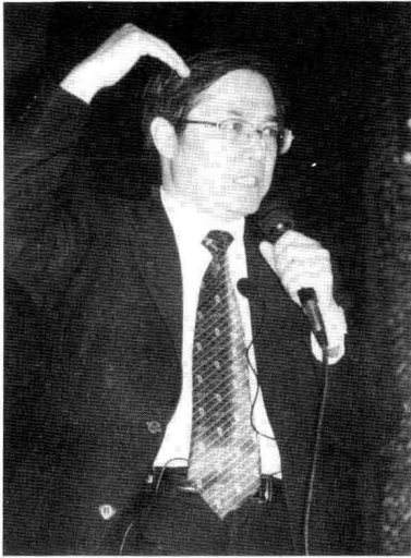
作者在清华大学大礼堂，面对几千名清华学子做全脑学习风暴激情演讲。