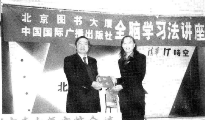
作者在北京图书大厦做全脑学习法讲座。