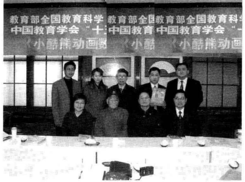
作者参加教育部全国教育科学“十五”规划课题“全脑教育”、中国教育学会“十五”科研课题“全脑创新”成果专家鉴定会。