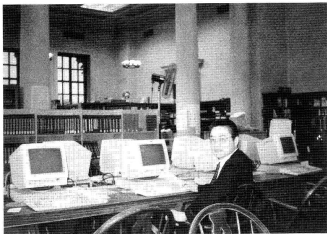
作者在哈佛大学 图书馆里。