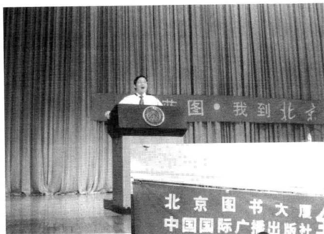
作者在北京大学为广大学子做全脑学习风暴讲演。