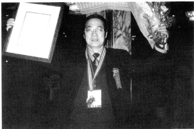
作者现任中国 国际家庭教育论坛 形象大使。