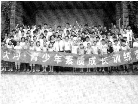
作者给河南青少年素质成长训练营做全脑学习培训课程后与学生们合影。