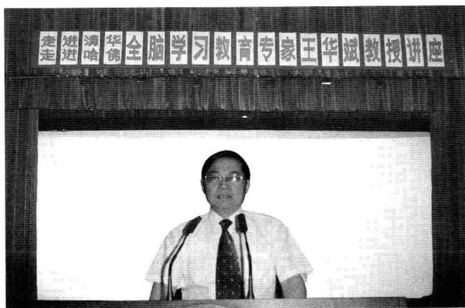
作者在新疆给广 大中学生做全脑 学习讲座。