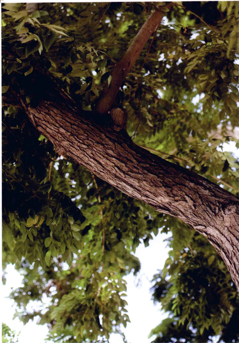
📍 30 年龄花梨树