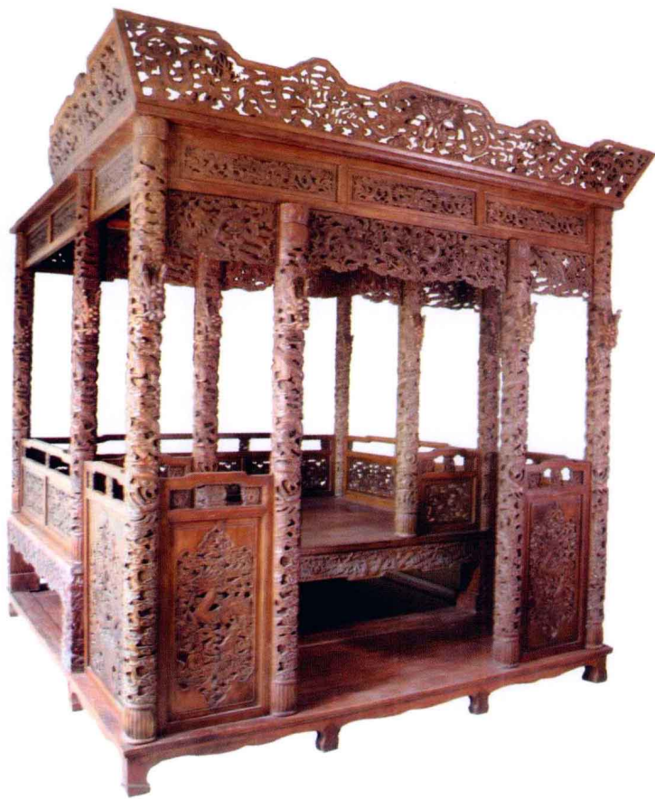
清 乾隆黄花梨雕龙纹拔步床 239 厘米 × 250 厘米 × 268 厘米