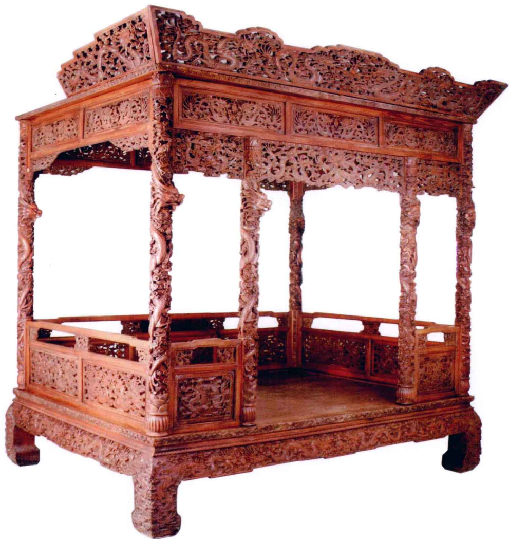
清 黄花梨雕云龙纹架子床 240 厘米 × 170 厘米 × 258 厘米