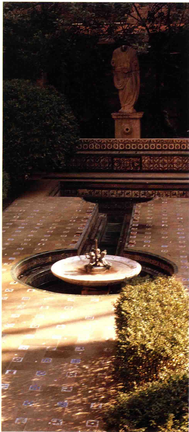
• SOROLLA美術館中的庭園，建於廿世紀初，是仿造阿南伯拉庭園。

為了符合都市花園化的觀念，這個新的行政區，擁有廣大的花園、高大的迴廊及拱門，另外也在整