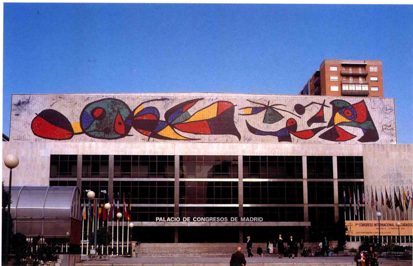
• 米羅為馬德里會議大廈所作的壁畫。