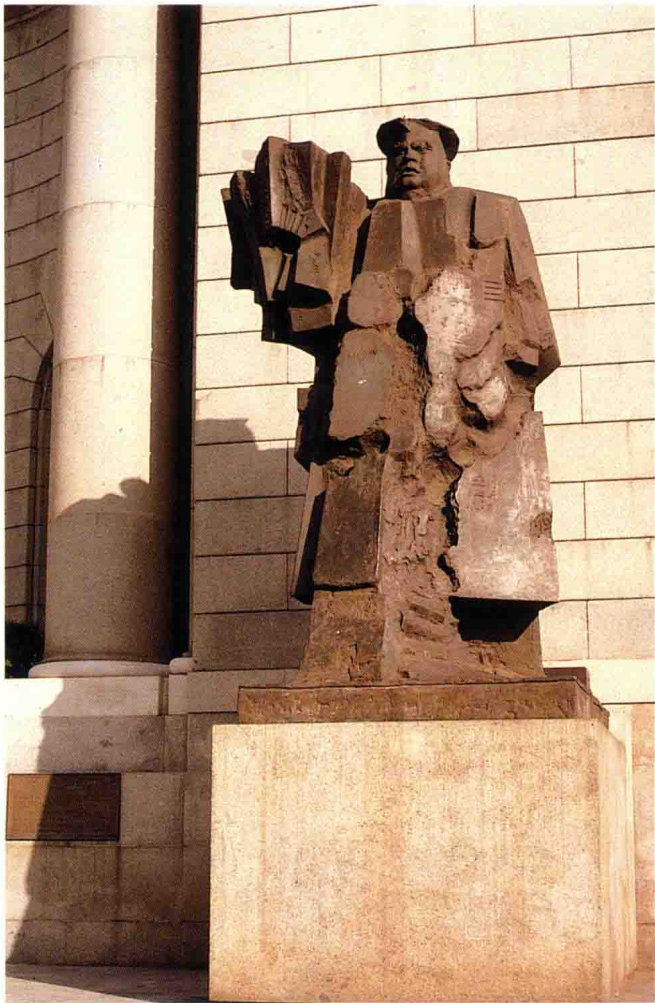
• 西班牙政治演說家杜維羅的雕像。