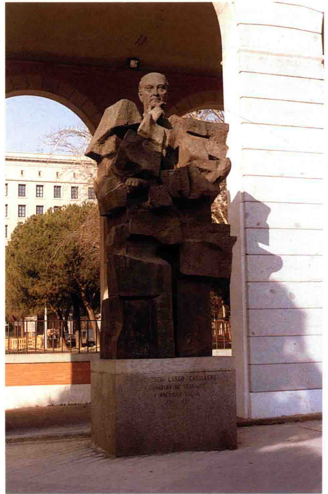
• 西班牙前建設院部長卡巴耶羅的雕像。

做各種不同的活動，例如話劇、歌劇、政治演講等，甚至有些還兼具鬥牛場的身分。但僅有一個廣場會被稱為PLAZA MAYOR，它不見得是最大的，但往往是該城市最初發展的核心。也就因為如此，議會或者市政府在才會座落於這一個廣場上。在很自然的情況下，逐漸形成為政治的中心。就拿馬德里來說，這個在1561年才成為西班牙首都的城市，雖然日後皇族在該城建立了皇宮、花園等，但是市民的主要活動還是以MAYOR廣場為中心。目前該廣場的雕像飛利浦三世（FELIPE III），該作品是由依利莎白二世（ISABEL II）在1847年，送給馬德里市政府。整個廣場會不斷整修過，例如廣場正面北邊的牆面的彩繪，就是這次整修時加添的，整個畫面為了配合廣場原有的氣氛，全部以傳統題材為主。