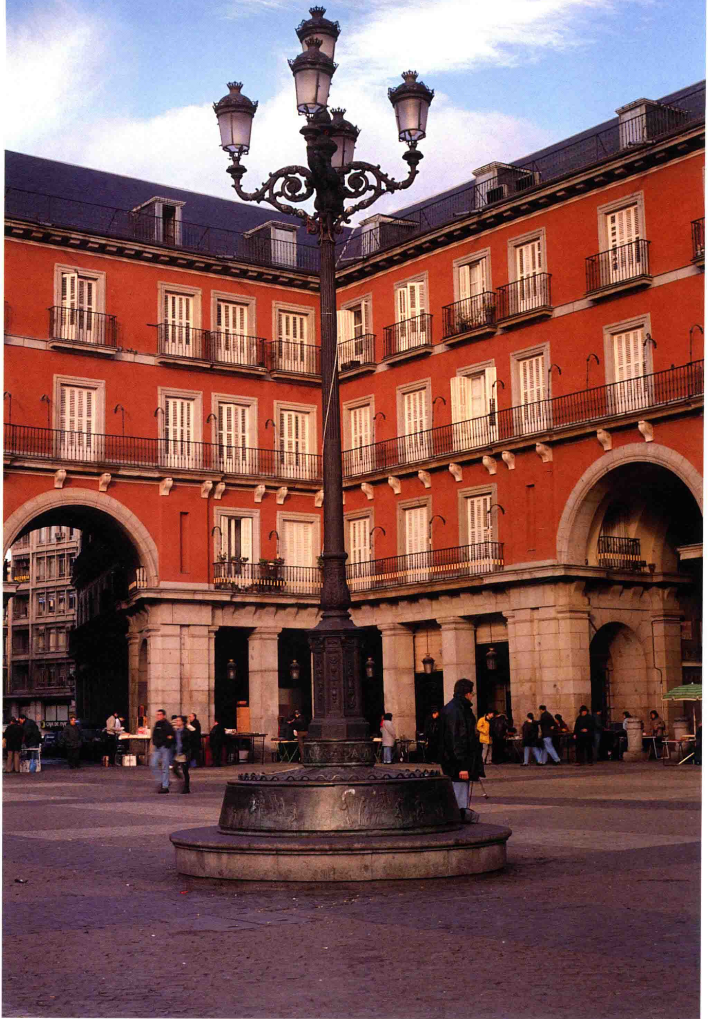
10 • 聳立於MAYOR廣場四角的大燈。