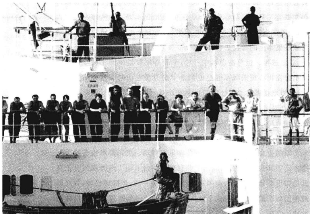
索马里海盗武力劫持乌克兰法依那号货轮

判赎金的过程中,索马里海盗曾表示,他们只要赎金,无意通过变卖船载武器来谋利。不过,为了防止海盗卸载法依那号上的武器弹药,美国驱逐舰霍华德(Howard)号长期在距法依那号 5 海里处守候。后来,又有数艘美国军舰赶赴这一海域。美国海军报告称海盗没有卸载任何武器。但有目击者说海盗将部分火箭筒带上岸。 ①