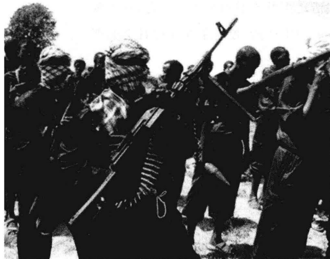
全副武装的索马里海盗

尽管存在着上述现象,但在进入21世纪后的最初几年内,索马里海盗仍然没有成为一个受到国际社会关注的突出问题。例如,联合国安理会设有专家组长期监督索马里的形势,特别是索马里的安全形势。在相当长的一个时期内,专家组报告没有涉及海盗这一主题。以