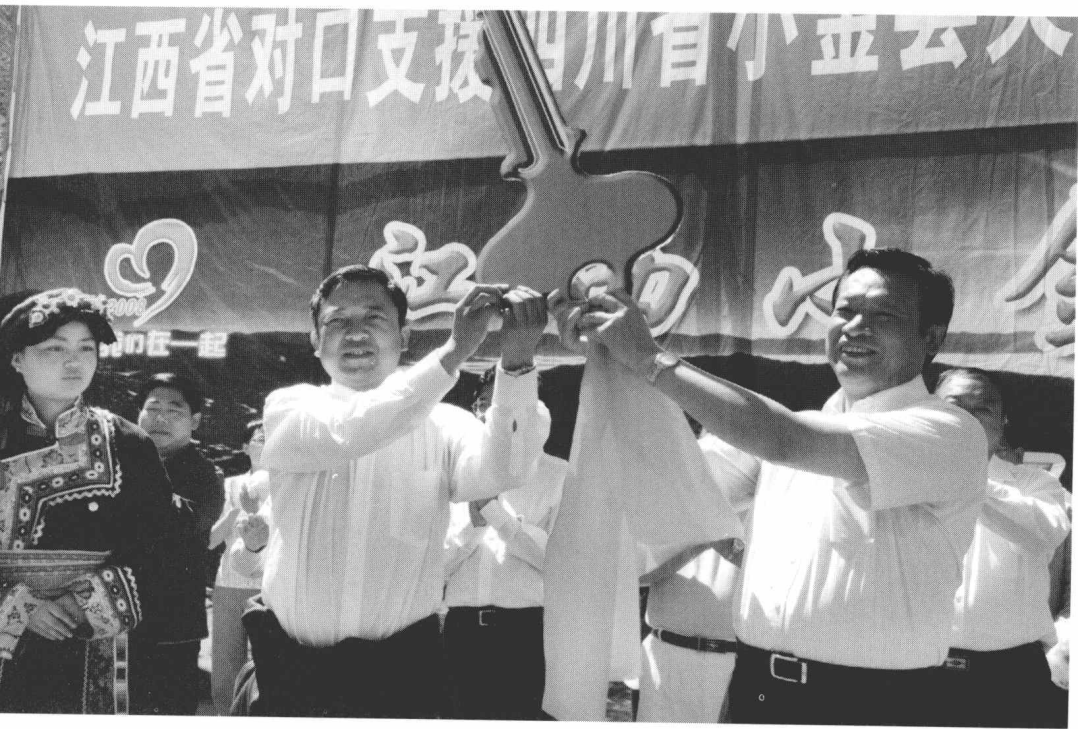
2008年7月8日，江西省对口支援小金县恢复重建启动仪式上，江西省省长吴新雄（右）、小金县县长泽仁达瓦（左）宣布江西省对口支援小金恢复重建正式启动。

交通最难。小金县除砂石外，所有建材都要从成都或雅安运入，路上要翻越4100米的夹金山。从成都到小金驾乘越野车需要10多个小时，大货车至少需要两天时间，有的工程车辆甚至四五天才能到达小金。