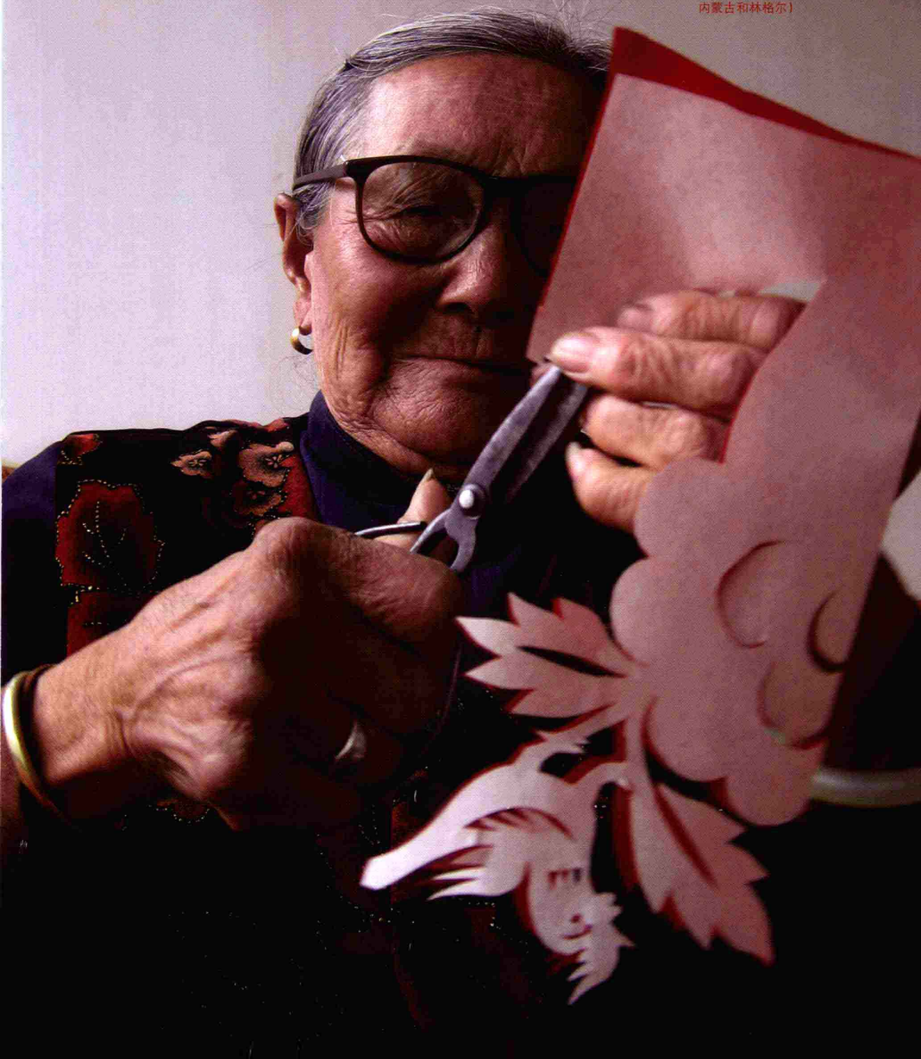
剪纸时心与手距离最近 (2010年段建珺拍摄于 内蒙古和林格尔)