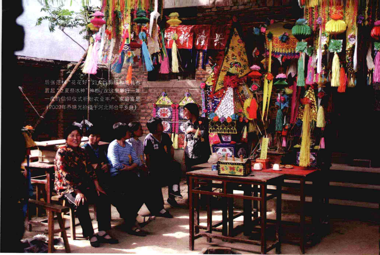
后张范村“花花好”妇女以剪纸和纸扎布置起“立夏祭冰神”神棚，在这里举行一年一度的信仰仪式祈盼农业丰产、家庭富足（2009年乔晓光拍摄于河北邢台平乡县）