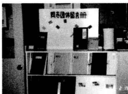
一九九六年二月二十四日為期一週的「彩虹情人週活動」，「同志空間行動陣線」於女書店佈置「同志團體留言冊」。

說到同志運動，在九〇年代以前的台灣，還是個陌生而模糊的字眼。整個寂寞而封閉的八〇年代，只有祁家威的身影踽踽獨行，不停以極端個人風格的方式來衝撞異性戀威權體制；