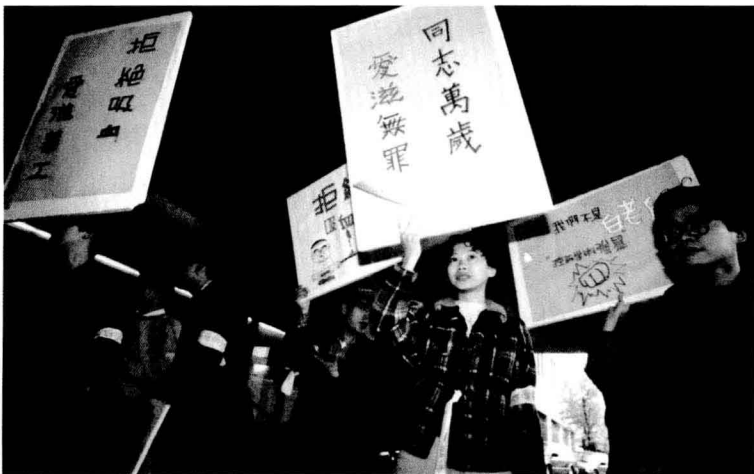
幾乎所有的同志團體都由義工組成，大家都是基於認同和尋找同路人的熱情驅動而來。