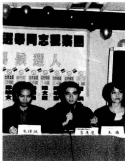
在過去十年中，不同的同志團體有許多互相合作的經驗。

在九〇年代，幾乎所有的同志團體都由義工組成，大家都是基於認同和尋找同路人的熱情驅動而來，組織多半是鬆散而脆弱的，卻要承擔著舉辦活動、會員聯誼、組織培訓、募款……等繁雜的會務問題。特別是學生社團，每一屆幹部都將因畢業而離開，經驗無法長期傳承，造成了各個社團起起落落的生態。多年下來，許多團體都面臨了轉型的問題，正在尋找重新出發的起點。目前，「同志諮詢熱線」已經發展出制度化的義工培訓制度，而活力充沛的「拉拉資推」也有較具規模的義工幹部，這對同志運動的傳承來說，是非常寶貴的經驗。