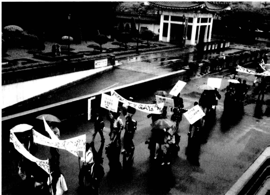
由「同志工作坊」發起，同志團體第一次走上街頭，抗議台大公衛所涂醒哲教授在研究報告中醜化同志。