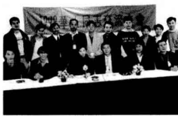
一九九八年華人同志交流大會。

本書希望邀請妳／你，以「我的同志運動經驗」為題，從自己的故事和觀點出發，一起來完成這段歷史的述說和回顧。本書不預設立場，不論是成長或挫敗、驕傲或失望、快樂或痛苦、鼓勵或批判，只要是妳／你真心的感受，都是這段珍貴歷史的一部分……。