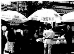
「同志空間行動陣線」於新公園舉行園遊會。