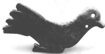
西周玉鸽 三门峡上村岭虢国墓地出土