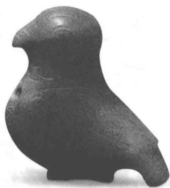
商玉鸽 殷墟妇好墓出土