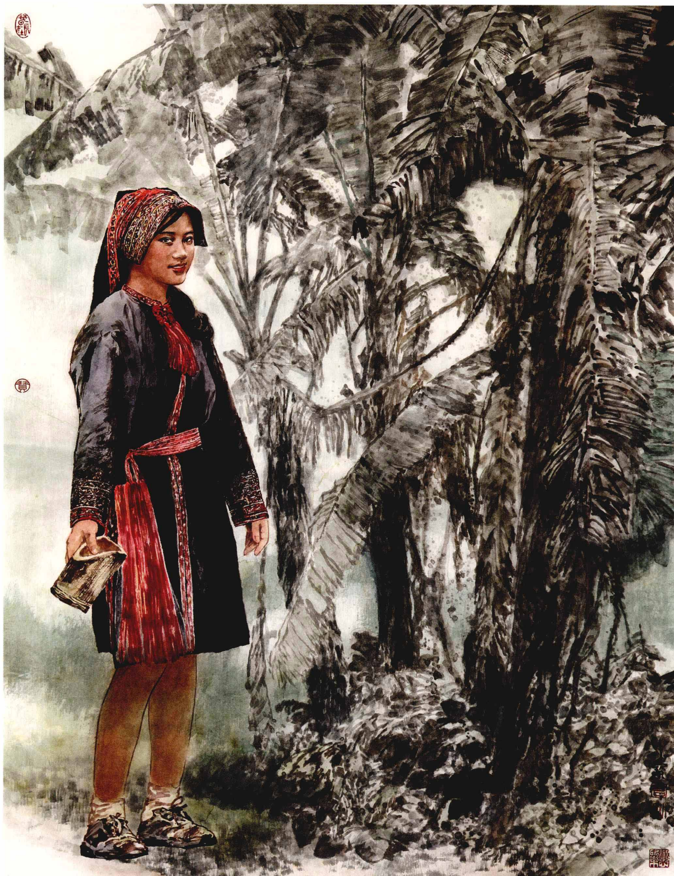
春风 119cm × 87cm 2010年