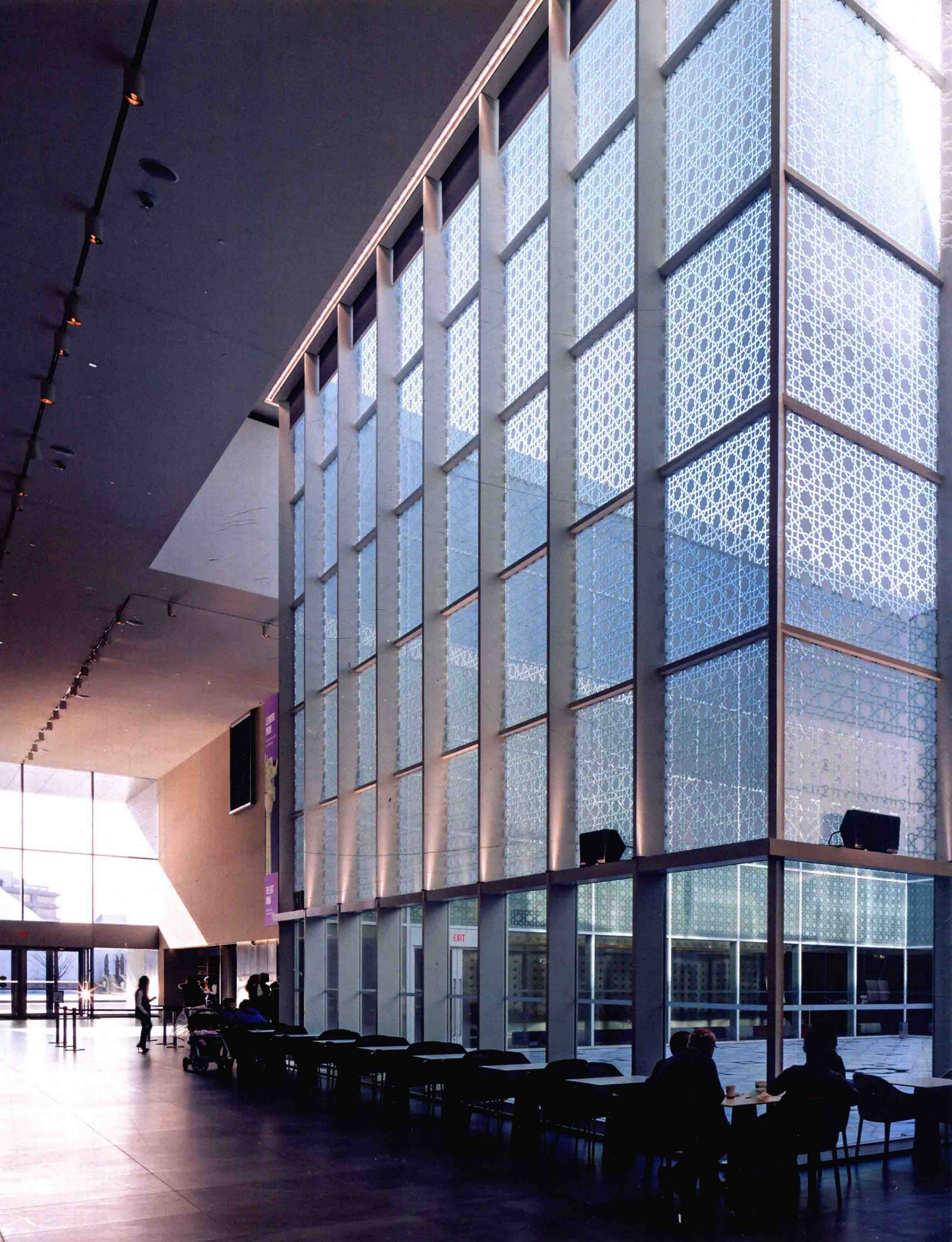
接待、展示区。考虑到未来各区域的功能可能会有一些变化，因此，建筑内部的设计采用了一种有利于未来调整的方案——固定不变的庭院作为伊斯兰文化的象征，被置于博物馆的中心位置，四周环绕其他主要功能区。图中左侧是主入口，可看到后方的查尔斯·柯里亚伊斯玛仪中心的祷告大厅