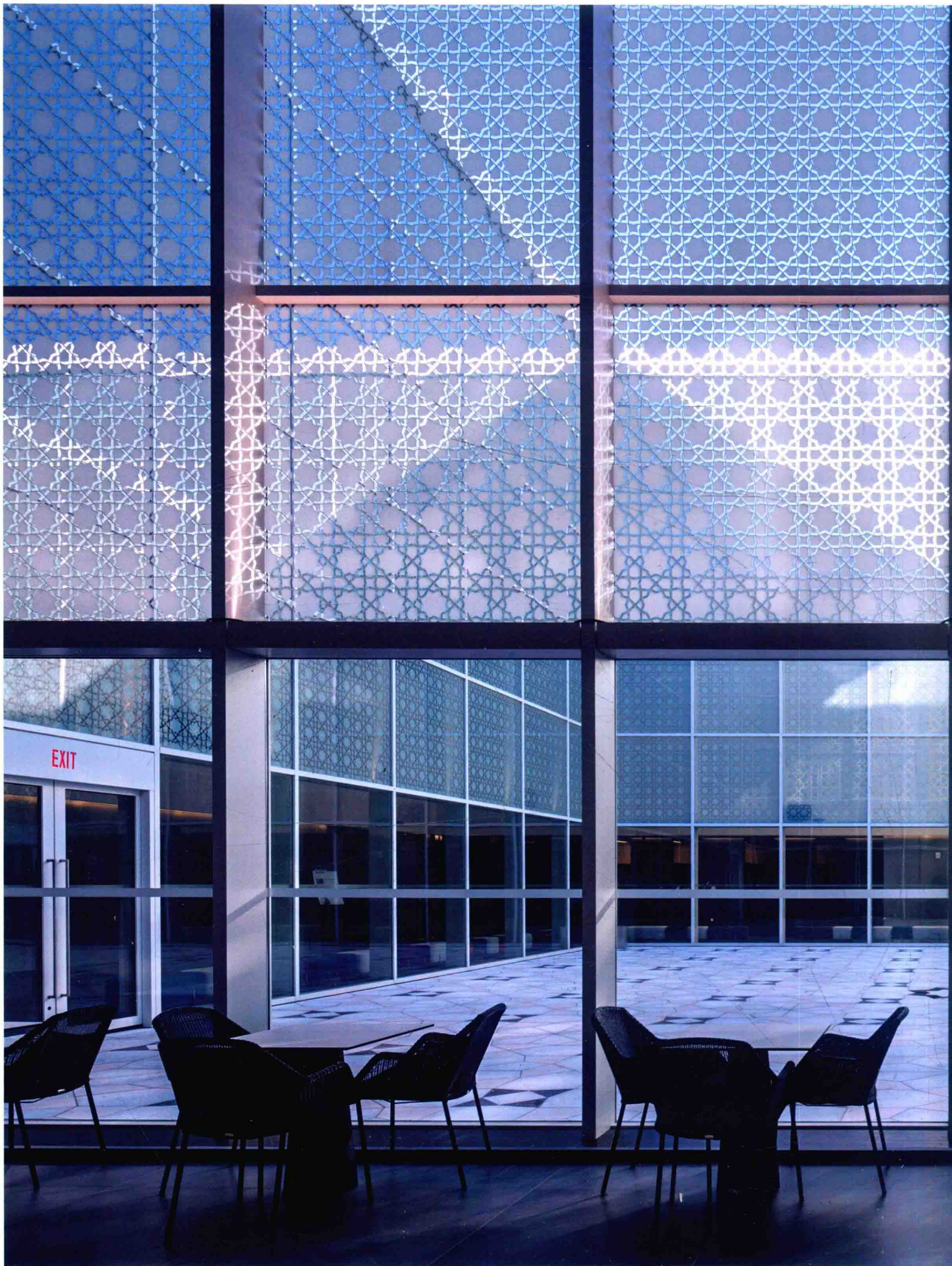
庭院。庭院玻璃上的图案以伊斯兰教的几何图案为原型，在一天当中，图案的影子会以各种形状映在庭院中。地板的图案由白色花岗岩、米色石灰石和青色花岗岩三种石材拼接而成