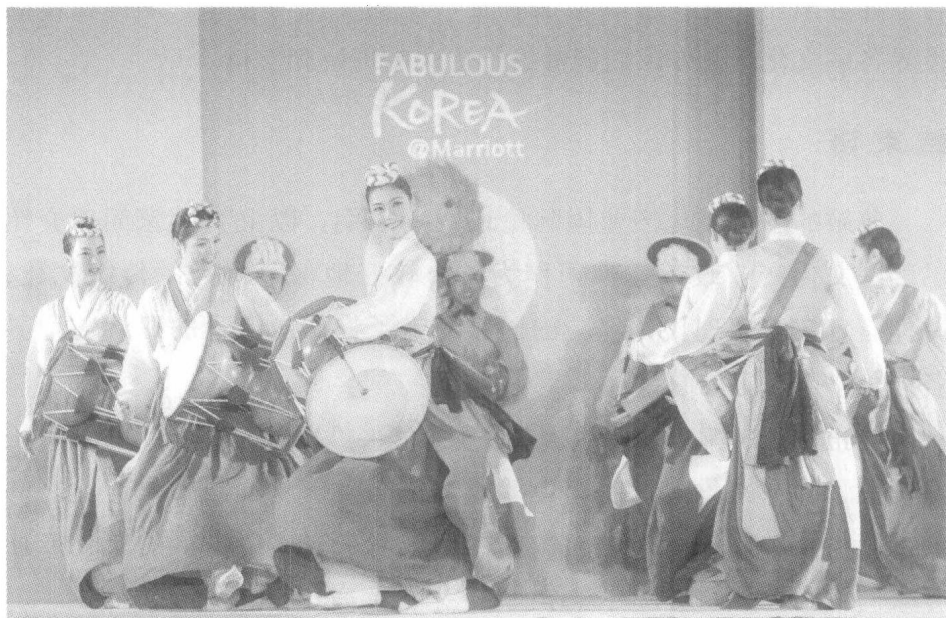
2011 年 11 月 4 日，于万豪酒店举办的 Fabulous KOREA 活动中韩国传统艺术团正在表演杖鼓舞。

因此，为了发展文化产业，我们需要不断分析和预测文化的变化趋势，进而使变化和创意相协调，同时要克服自我中心意识和主观主义，做事要相互协作，并力求客观。