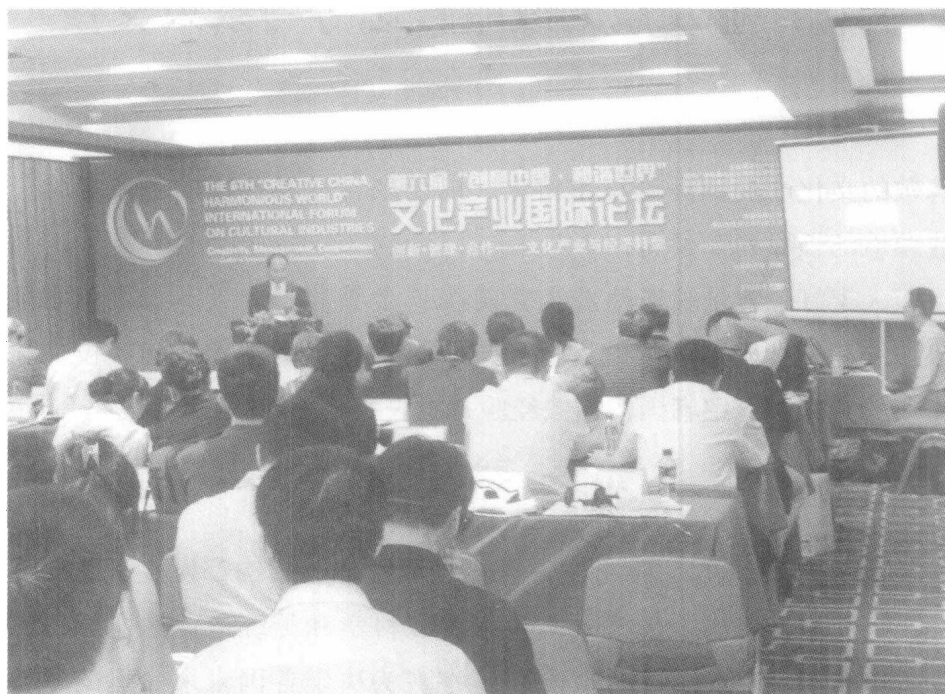
2011年7月30日，笔者在“第六届文化产业国际论坛”进行基调演讲。

这种趋势在韩国也一样。过去集中于政治和经济发展的政府与国民的注意力，现在已经逐渐转向文化领域。韩国政府认为文化产业不仅可以提高国民的生活质量，而且还可以提升国家品牌(National Brand)，因此将其列入十大新增长动力产业之一，进行重点培养。