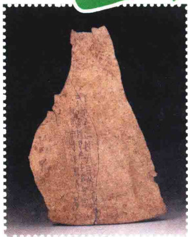
图 1.1.1 商“妇好冥”卜骨 天津博物馆馆藏

为完整的文字,已经初步具备了中国书法的笔法、结构、章法三要素。其用笔线条严整有力,曲直粗细均备,笔画多方折,对后世的篆刻有一定的影响。文字虽大小不一,但比较均衡对称;虽受骨片大小和形状的影响,仍表现了镌刻的技巧