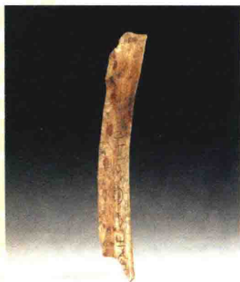
图 1.1.2 商“月有食”卜骨 天津博物馆馆藏

学、文字学、考古学等学科都具有极其重要的意义。“甲骨书法”长期以来的流行，证明了它永恒的魅力。甲骨文的发现以及由此引发的殷墟发掘，对中国考古学具有划时代的意义。