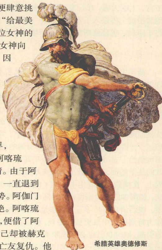
希腊英雄奥德修斯

加阿喀琉斯（希腊方面的主要英雄）父母的婚礼，便肆意挑起事端。她把一个金苹果扔在宴会桌上，上面写着“给最美的女神”，这就引起了赫拉、雅典娜、阿佛罗狄忒3位女神的争抢，宙斯让她们去找特洛伊王子帕里斯评判。3位女神向帕里斯许了愿。帕里斯把金苹果判给了阿佛罗狄忒，因为她答应让帕里斯娶到世间最美的女人。事后，阿佛罗狄忒把帕里斯引到斯巴达，骗走了斯巴达王墨涅拉俄斯的妻子——美丽的王后海伦，从而爆发了特洛伊与希腊之间长达10年之久的战争。到了第10年，希腊联军统帅阿伽门农和阿凯亚部族中最勇猛的首领阿喀琉斯争夺一个在战争中掳获的女子，由于阿伽门农从阿喀琉斯手里抢走了那个女俘，阿喀琉斯愤而退出战斗。《伊利亚特》的故事就以阿喀琉斯的愤怒为开端，集中描写那第10年里51天的事情。由于阿凯亚人失去最勇猛的将领，他们无法战胜特洛伊人，一直退到海岸边，抵挡不住伊利昂城主将赫克托尔的凌厉攻势。阿伽门农请求同阿喀琉斯和解，请他参加战斗，但遭到拒绝。阿喀琉斯的密友帕特罗克洛斯看到阿凯亚人将要全军覆灭，便借了阿喀琉斯的盔甲去战斗，打退了特洛伊人的进攻，但自己却被赫克托尔所杀。阿喀琉斯感到十分悲痛，决心出战，为亡友复仇。他终于杀死赫克托尔，并把赫克托尔的尸首带走。伊利昂的老王（赫克托尔的父亲）普里阿摩斯到阿喀琉斯的营帐去赎回赫克托尔的尸首，暂时休战，为他举行盛大的葬礼。《伊利亚特》这部围绕伊利昂城的战斗的史诗，便在这里结束。