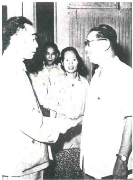
◀ 1956年7月，国务院总理周恩来（左一）接见出席中华医学会全国会议的香港代表、新会籍乡亲李崧（右一）