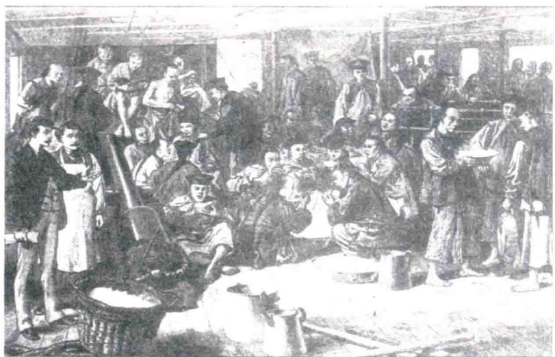
▲ 华人乘搭太平洋邮轮公司“亚拉斯加”号轮船赴美(漫画)