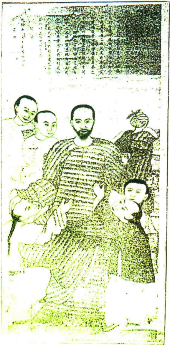
▲ 清康熙养心殿御医高竹（高嘉淇）（中）画像