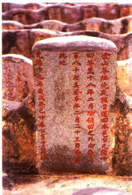
◀ 位于新会黄坑海槐的新会旅美华侨义冢（金山埠华侨义冢）及碑志，1993年2月重修