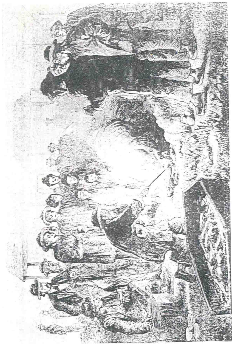
▲ 美国旧金山华人坟场“捡金”（“起身”）仪式（漫画）