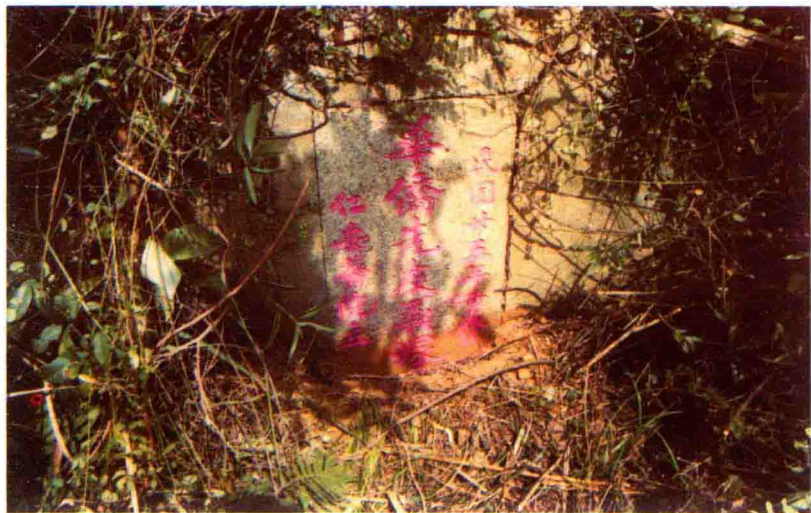
▲ 位于新会黄坑大槐的华侨先友义冢，民国二十五年（1936）重修