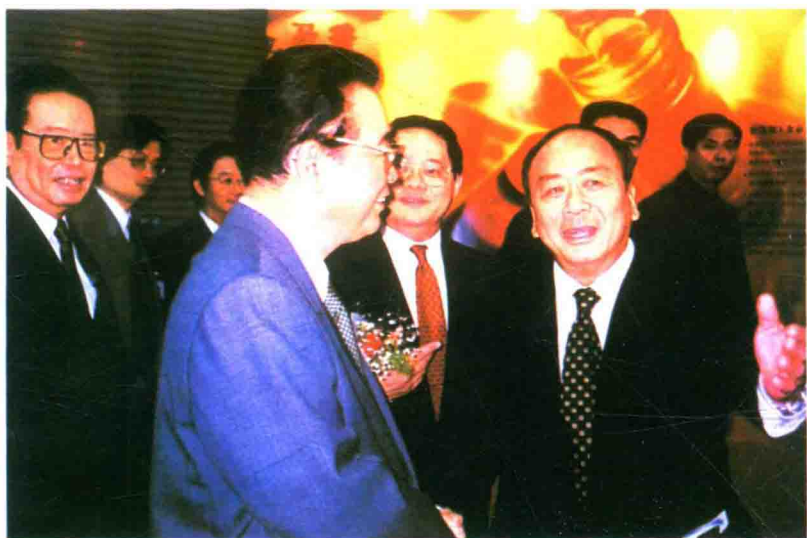
▲ 1997年3月，在北京迎回归香港博览会上，国务院总理李鹏（前左）接见新会旅港乡亲、李锦记集团有限公司主席李文达（前右）