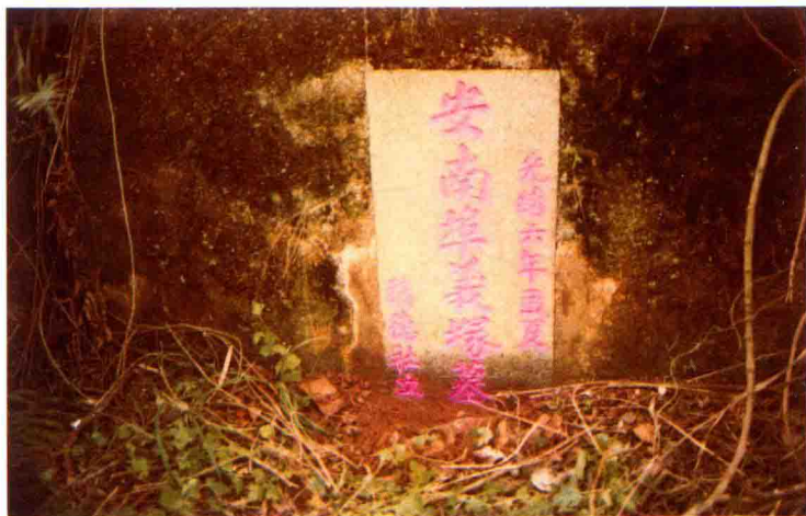
▲ 位于新会黄坑木山的新会旅越南华侨义冢（安南埠义冢墓），清光绪六年（1880）立