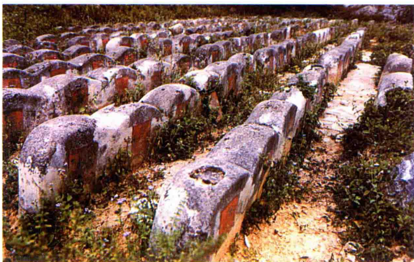
▲ 位于新会黄冲坑鹤嘴的华侨义冢