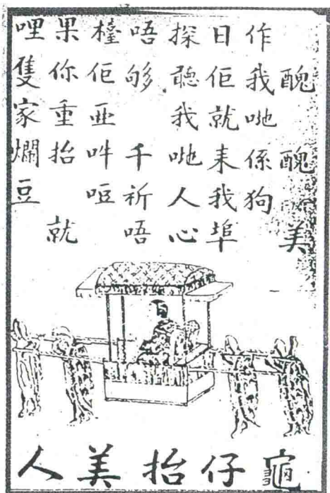
漫画《龟仔抬美人》(部分)