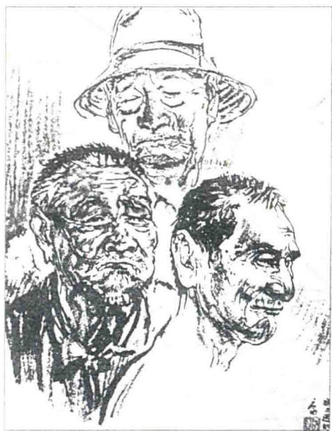
◀ 司徒乔画的《三个老华工》