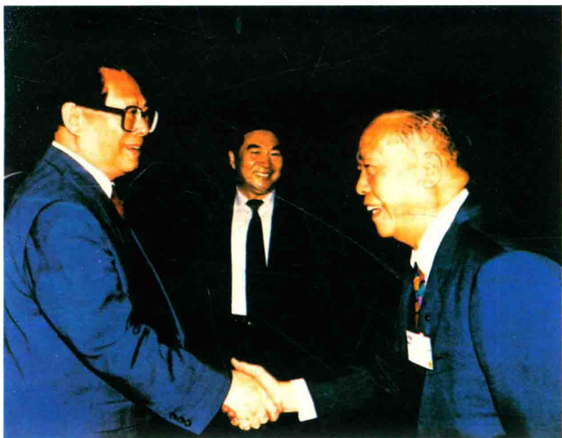
▲ 1994年6月，香港工商界代表团访京。图为国家主席江泽民（左一）接见新会旅港乡亲李世奕（右一）