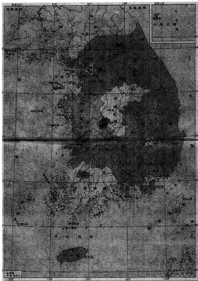
图 0.3 韩国行政区划