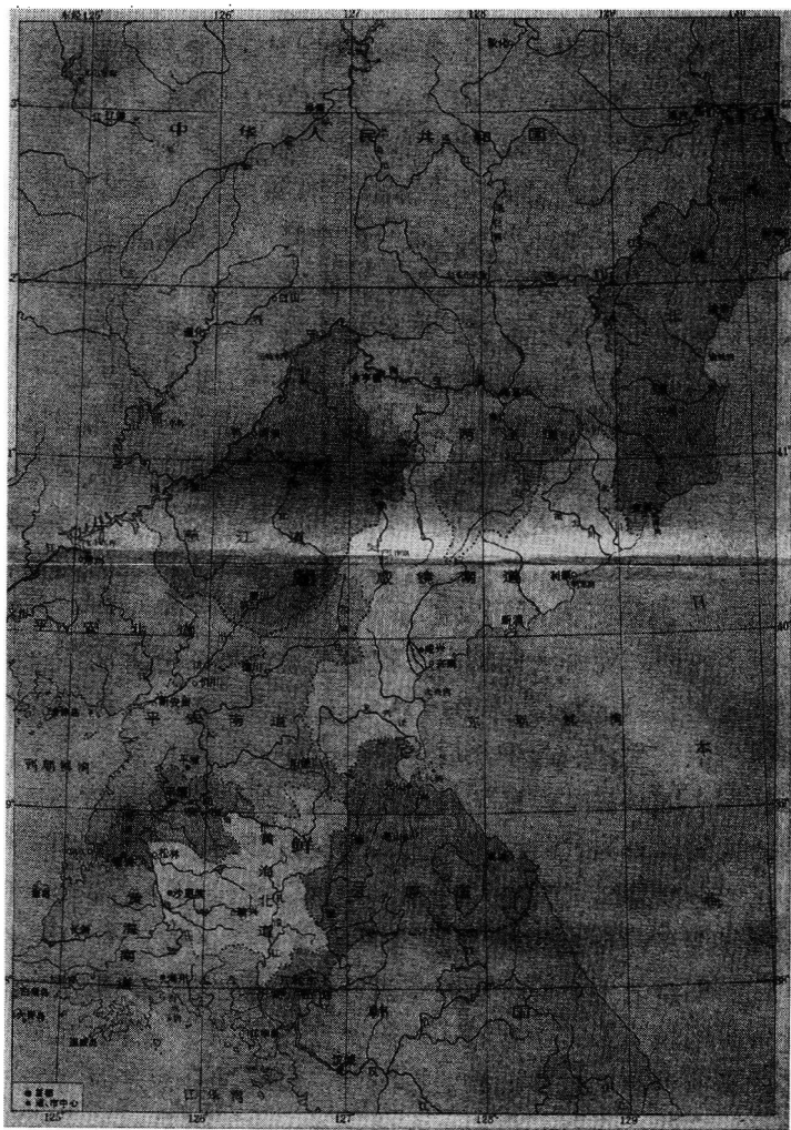
图 0.2 朝鲜行政区划

江道、平安北道、平安南道、江原道、黄海北道、黄海南道九道，平壤特别市以及南浦市、开城市两个直辖市（图 0.2）。韩国则有京畿道、江原道、忠清南道、忠清北道、庆尚北道、庆尚南道、全罗北道、全罗南道、济州道九道，首尔特别市以及仁川市、大田市、大邱市、蔚山市、光州市、釜山市六个广域市（图 0.3）。