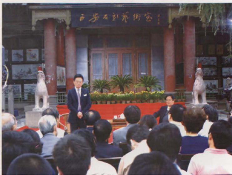
中央电视台《艺术人生》栏目走进西安碑林。