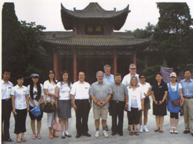
2009年6月16日，奥斯卡颁奖主席一行来我馆参观。