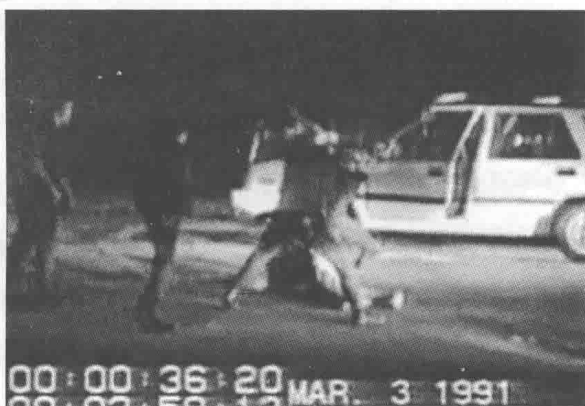
罗德尼·金被警察殴打的录像一遍遍地播放

的今天，我们仍然时不时地在电视里看到这段录像。我们相信，在今后的许许多多年里，这段录像还将经常出现在美国的各种电视专题节目里，比如说，讨论司法公正的，讨论警察权限的，等等。当然更多的，就是出现在讨论种族问题的电视节目上。