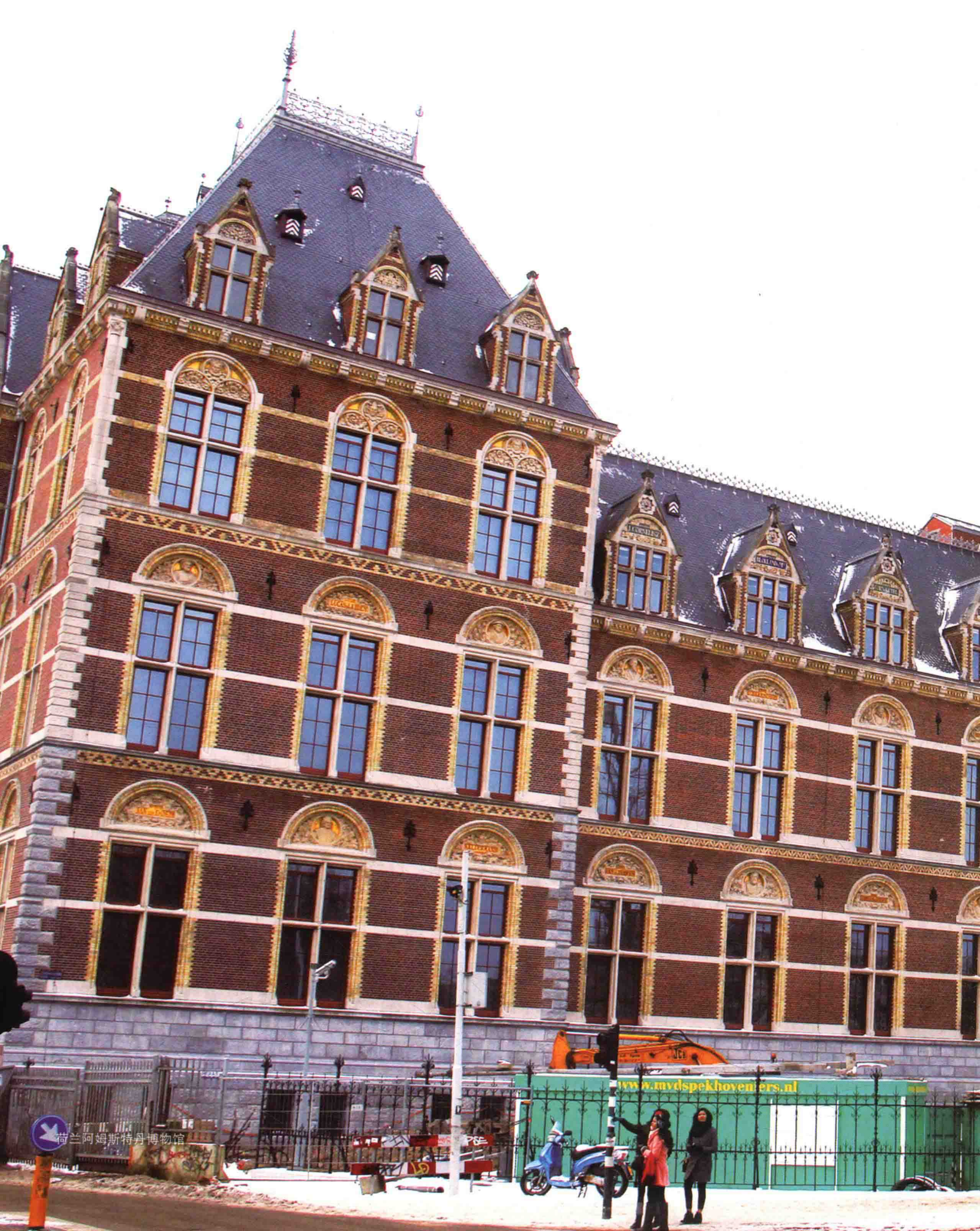
荷兰阿姆斯特丹博物馆