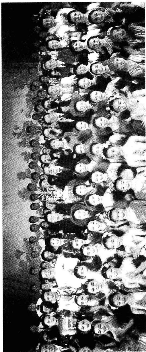
省委书记孟建柱（四排左起6）省长黄智权（四排右起3）陪同江泽民主席（四排中）接见赣南客家采茶歌舞剧团全体演职员以及省直剧团参演人员。站在江泽民主席和曾庆红副主席（四排右起6）之间的是客家采茶戏著名演员，梅花奖得主龙红。