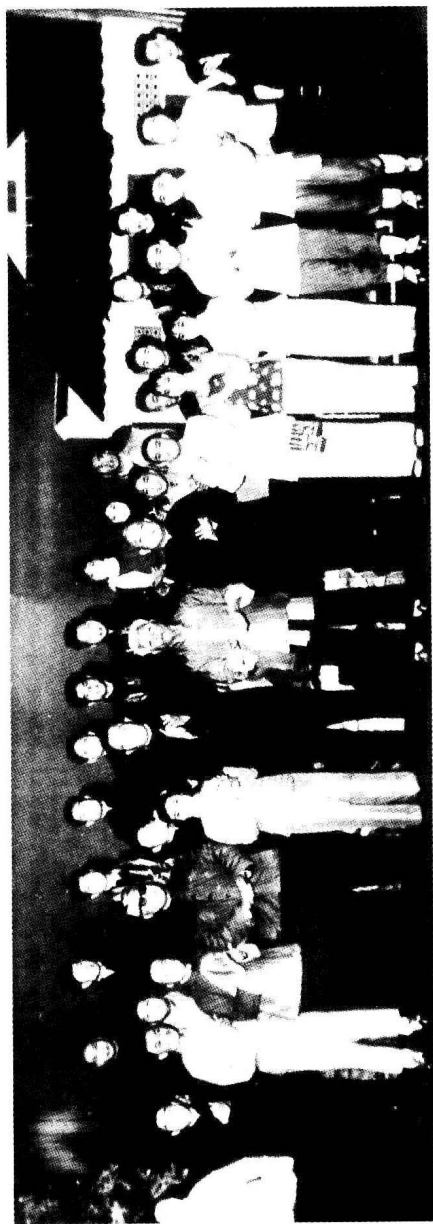
李先念、罗瑞卿接见江西赣南客家采茶剧团《怎么谈不扰》等剧组的演职人员