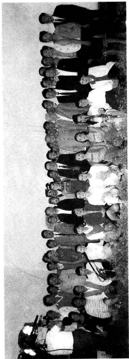
李鹏接见赣南客家采茶歌舞剧团演出全体演职员