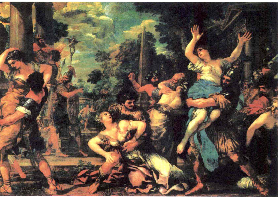
《劫持萨宾妇女》 意大利 科尔托纳 约1629年 277cm×422cm 布 油彩 罗马 古罗马神殿博物馆

马，受到了拉斐尔、米开朗基罗、科雷乔等人的影响。这些文艺复兴大师们的艺术对于他创作宏大、华丽的天顶画帮助颇多。他也去过佛罗伦萨、威尼斯，并在那里作过画，但主要创作在罗马。其代表作有：巴尔贝里尼宫的天顶画(1633—1639)、帕姆菲里宫天顶画(1651—1654)、圣马力亚·莫·华里契提教堂的天顶画(1647—1650)以及佛罗伦萨彼蒂宫的湿壁画(1640—1647)等，其中以巴尔贝里