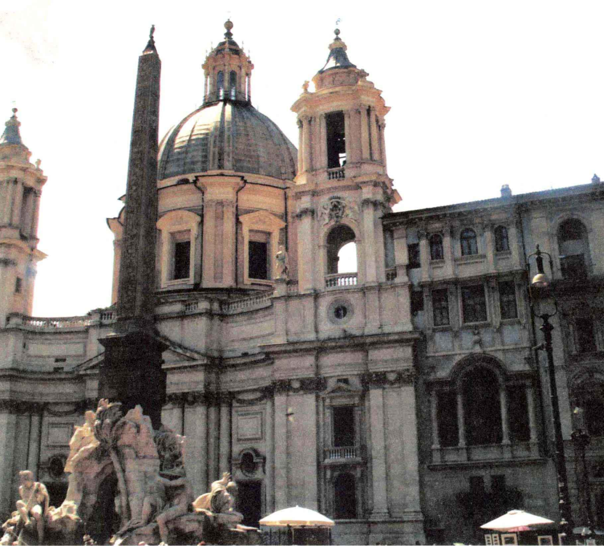
「不同寻常教堂」 意大利 博罗米尼