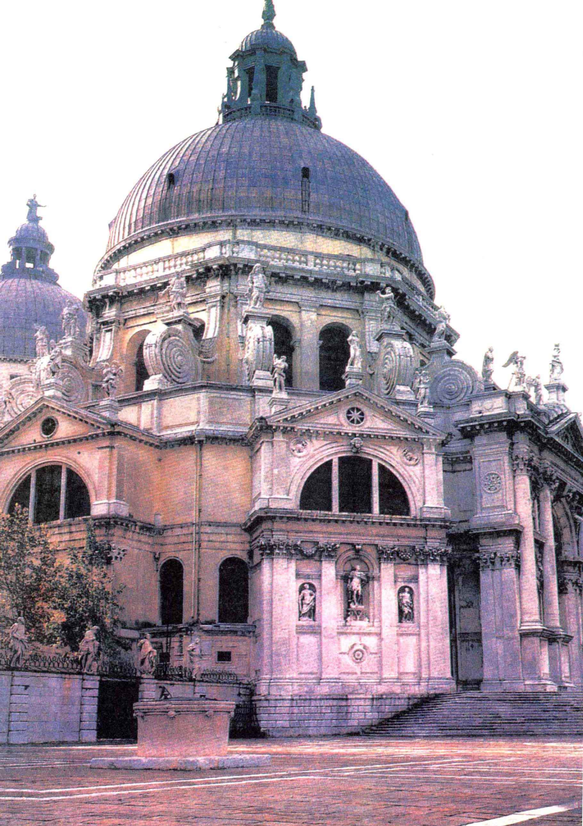
「圣玛丽亚教堂」意大利 隆盖纳 1631—1648年 威尼斯