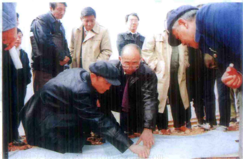
1992年11月，铁道部副部长屠由瑞到宝中铁路现场办公，在一处处长吴志强、总工程师乔培枫陪同下检查一处施工现场。