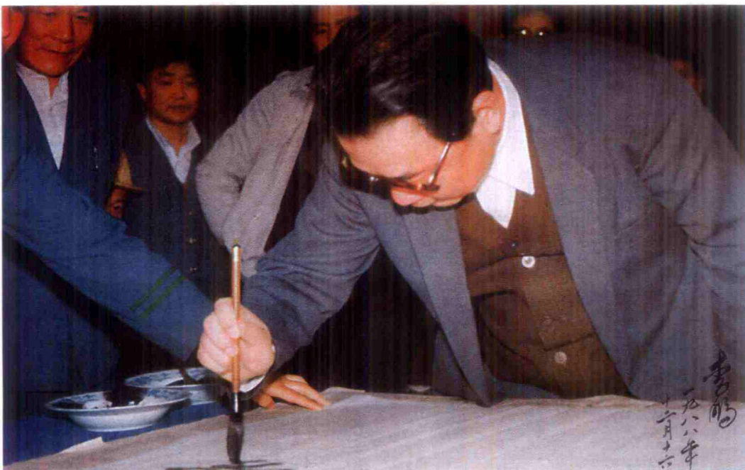
1988年12月，李鹏总理出席衡广复线通车典礼时题词。