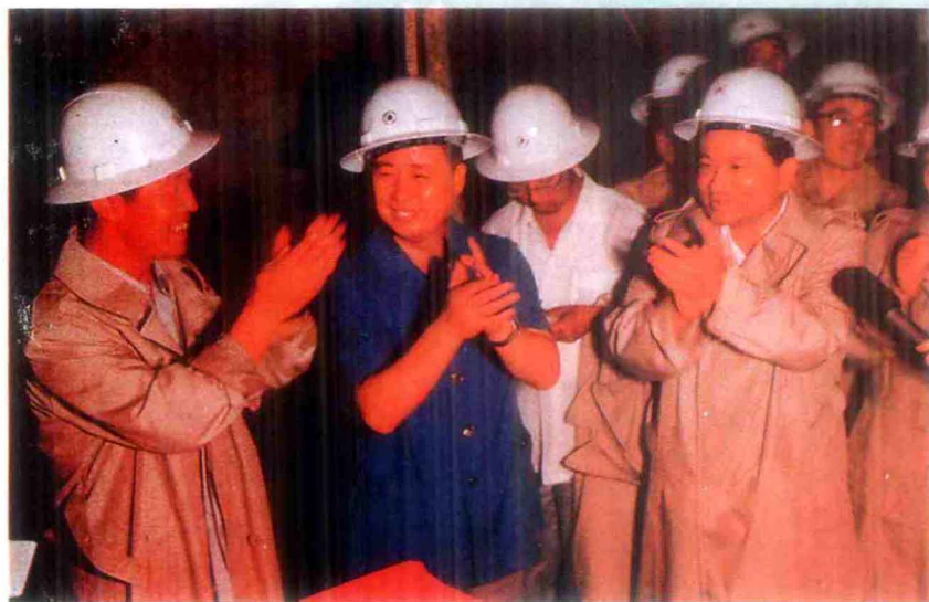
1986年11月，衡广铁路复线南岭隧道贯通时，铁道部副部长孙永福同湘粤两省领导到现场祝贺。