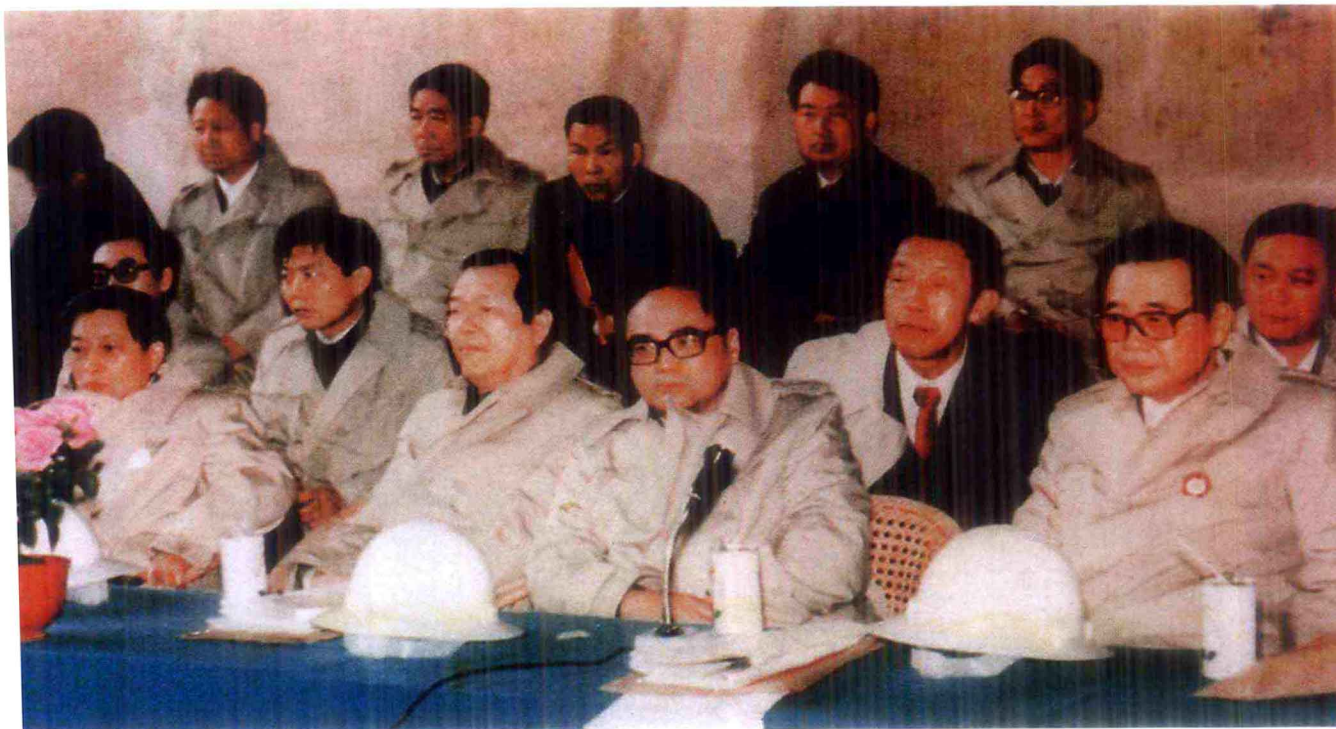
李鹏总理听取南岭隧道施工情况汇报。