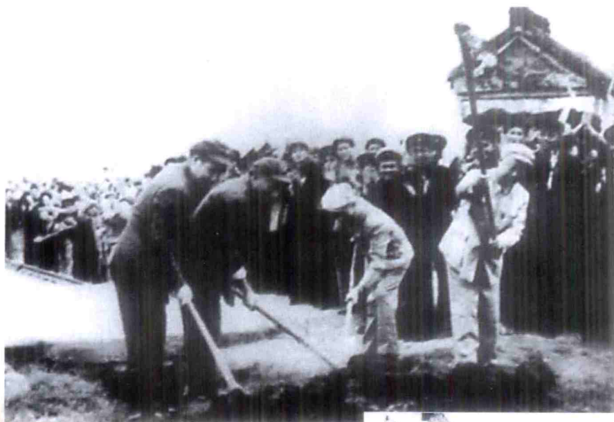
1952年7月2日，铁道部部长腾代远、西南军区副司令员李达、川西行政公署主任李井泉等在宝成铁路开工典礼上，挥锹破土，掀开会战序幕。