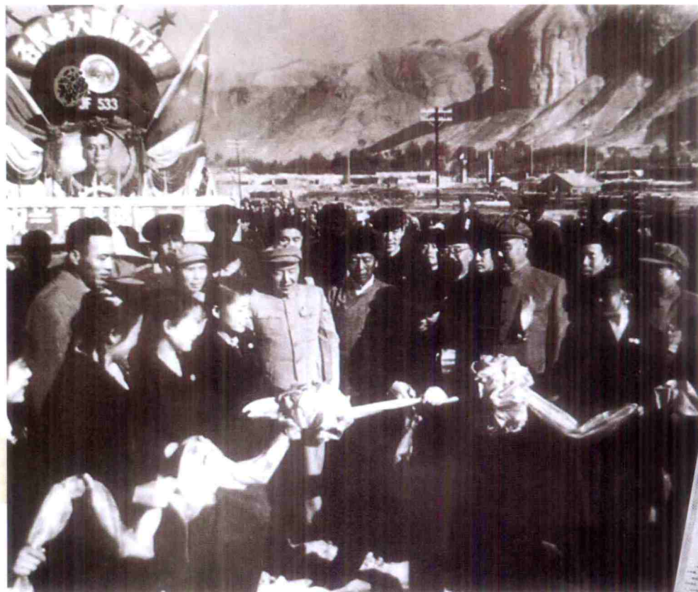
1959年10月，西宁火车站人山人海，举行了隆重的兰青铁路通车典礼，中共青海省委书记袁任远为通车剪彩，青海日报社特发《号外》报道这一重大喜讯。