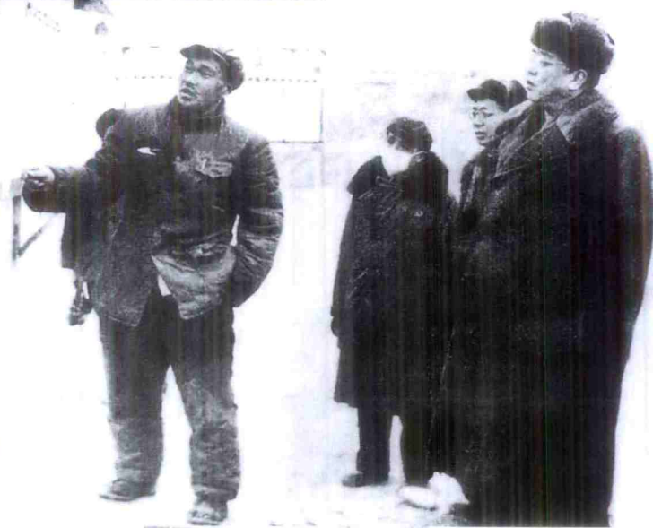
铁道部副部长武竞天在兰青铁路筑路工地检查工作。