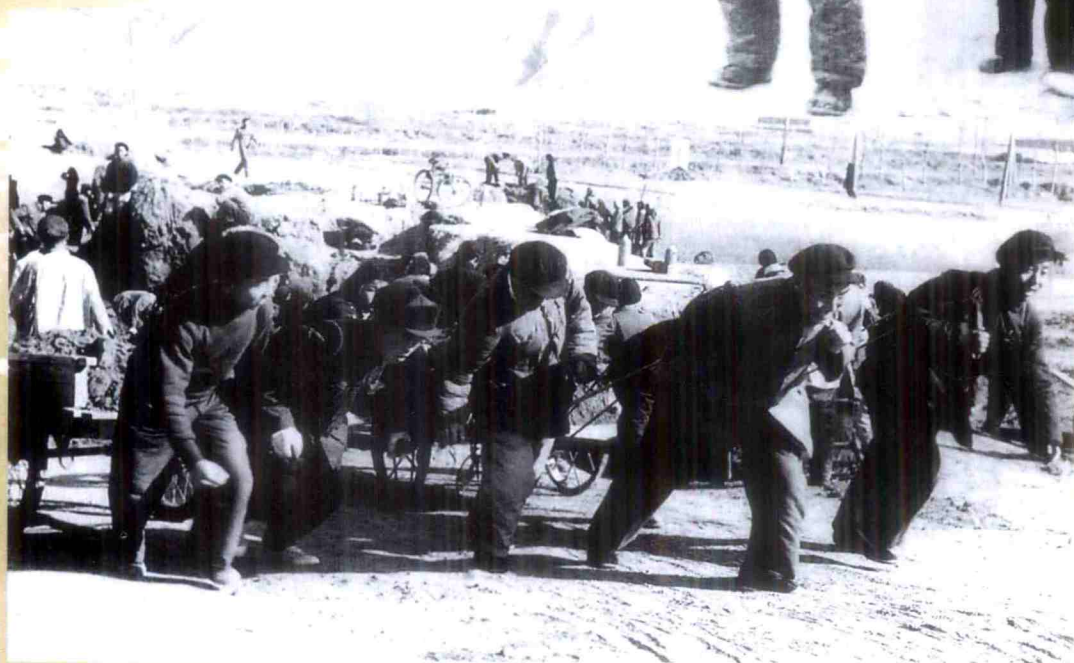
中共青海省委领导在兰青铁路西宁火车站候车大楼建筑工地集体参加劳动。