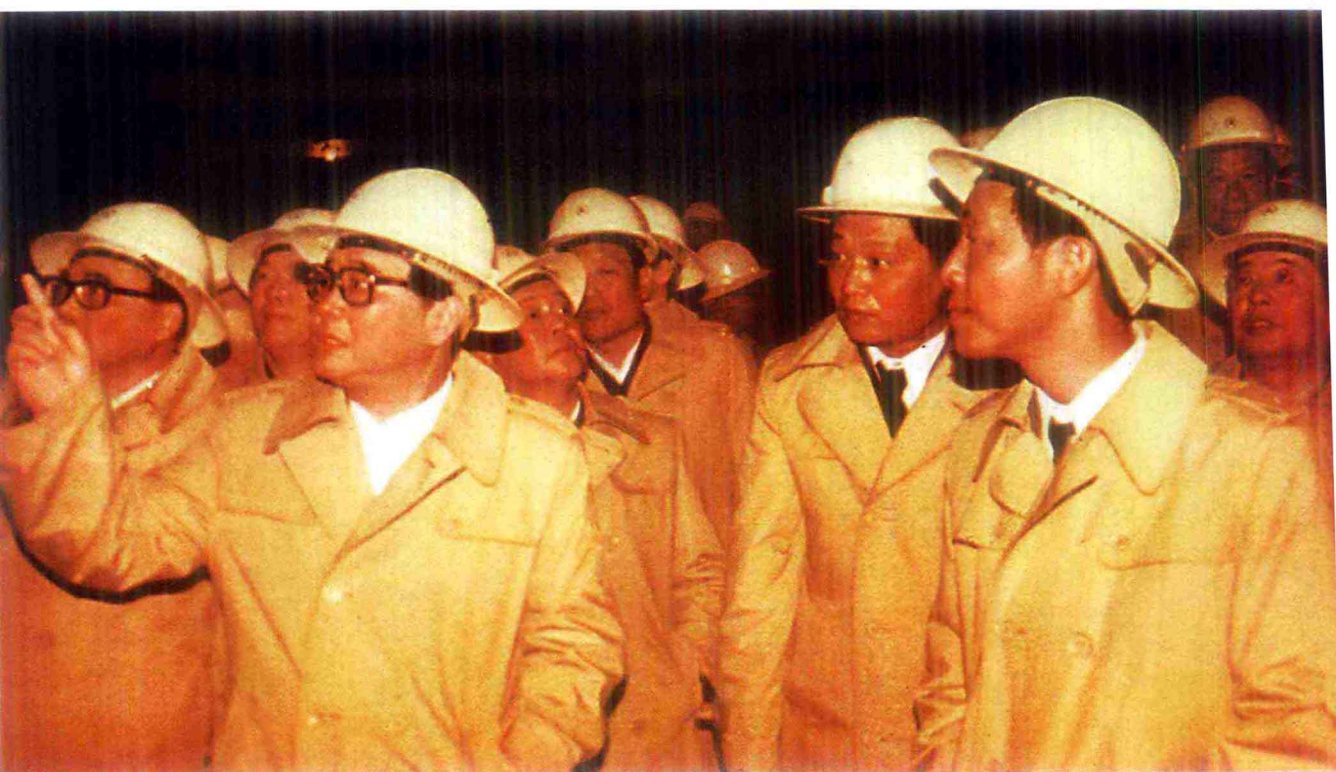
1987年3月，国务院总理李鹏在铁道部部长丁关根和水电部、冶金部、湘粤两省领导及铁五局局长杨瑾华、局党委书记董崇陪同下视察南岭隧道。