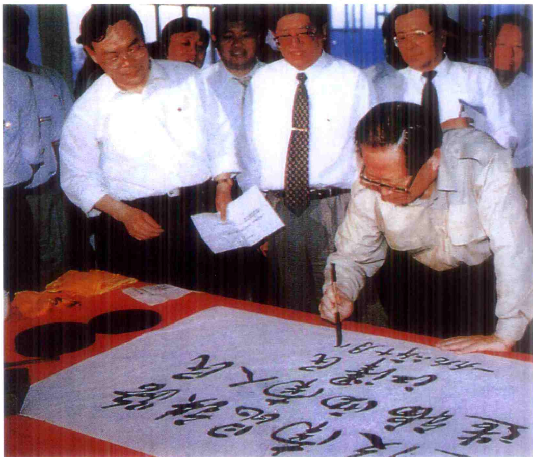
1996年10月，江泽民总书记为南昆铁路题词。