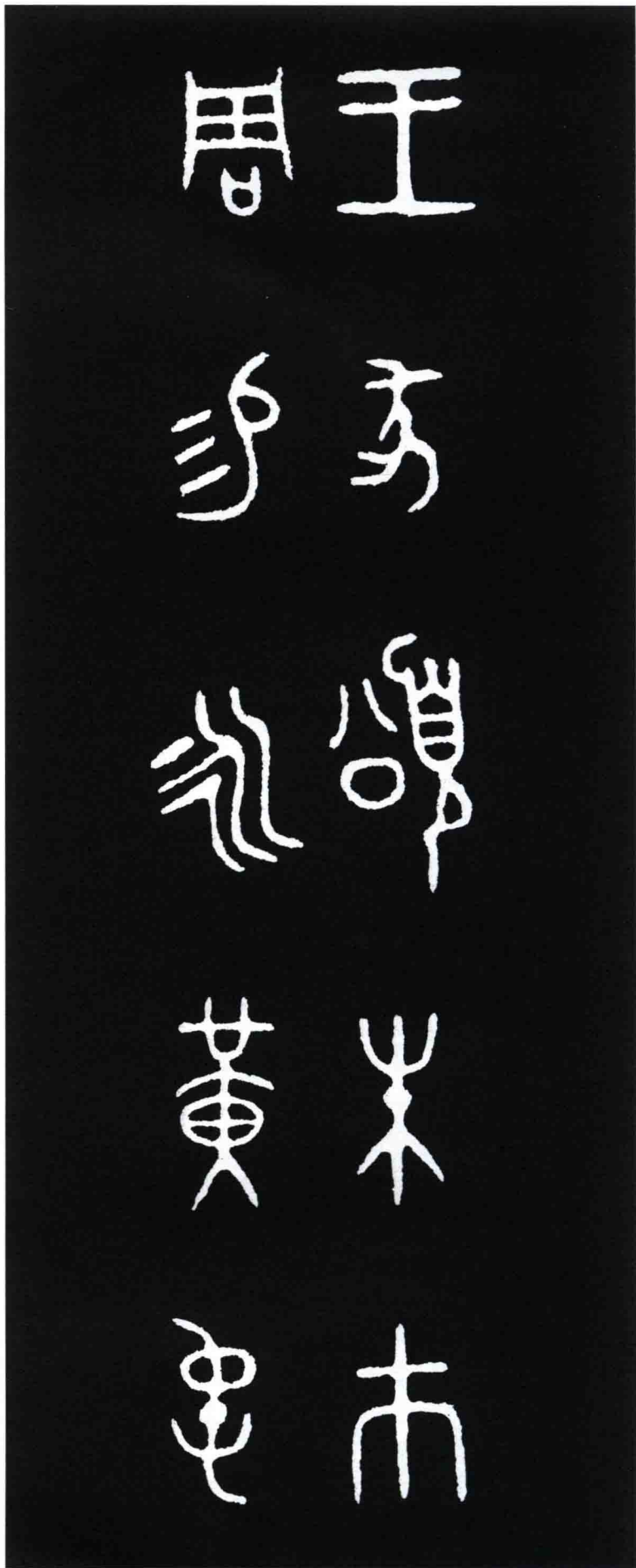
王家頌朱市（黻） 周易永（咏） 黄屯（裳）