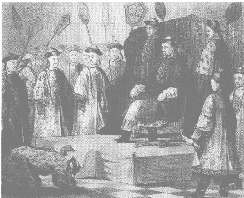
西方版画中的清廷大臣跪拜乾隆皇帝图

信，因为他听说大清帝国是一个很重视礼制的国家，凡是去中国的外国使节，要觐见皇上必须得行三跪九叩之礼。