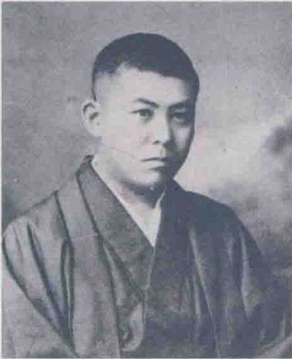
谷崎潤一郎二十七歲

二十世紀初，受到西方唯美主義的影響，日本文壇吹起了一股耽美浪潮，而谷崎潤一郎以日式生活為題材，描寫出大和民族追逐官能卻又壓抑的情慾觀，將唯美文學推上了新的高峰。