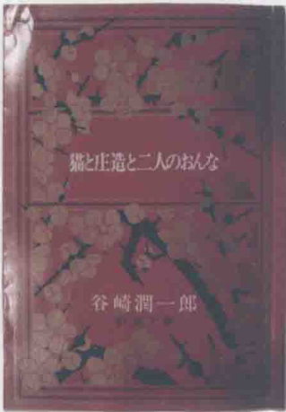
《貓與庄造與兩個女人》／新潮社