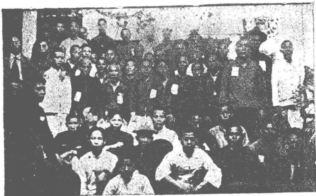
廣東第二次全省農民代表大會出席代表之一部