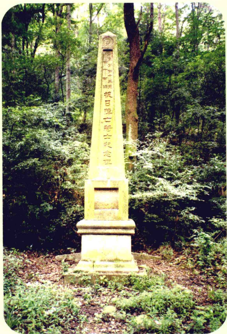
长沙岳麓山赫石坡下 七十三军之七十七师抗日阵亡将士纪念碑