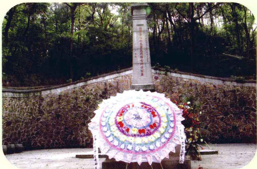
公祭活动时敬献的花圈