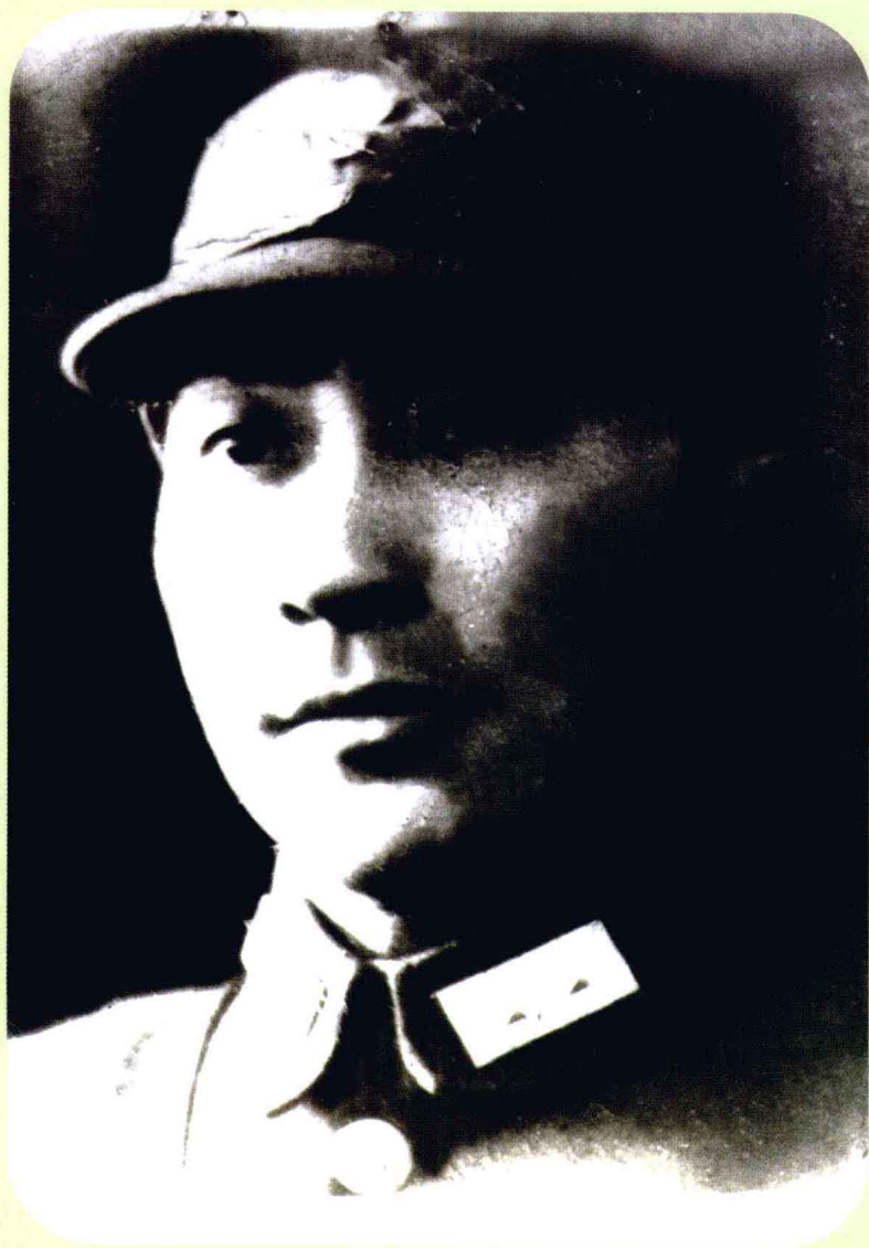
长沙会战时的彭位仁将军