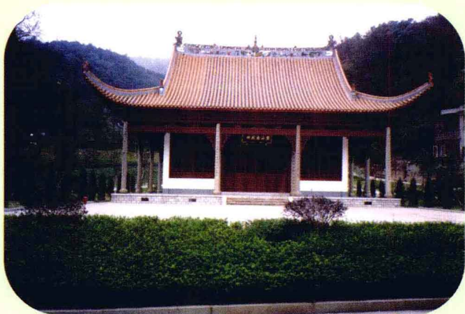
长沙岳麓山忠烈祠