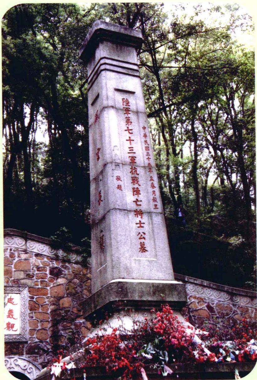
每年清明节人们都会采集岳麓山上的鲜花祭奠抗战英灵