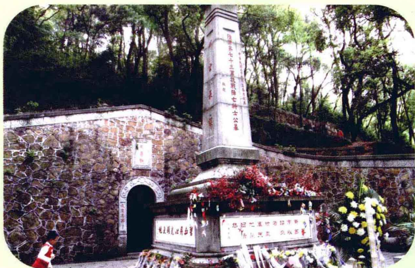
各学院的学生敬献的花篮和鲜花