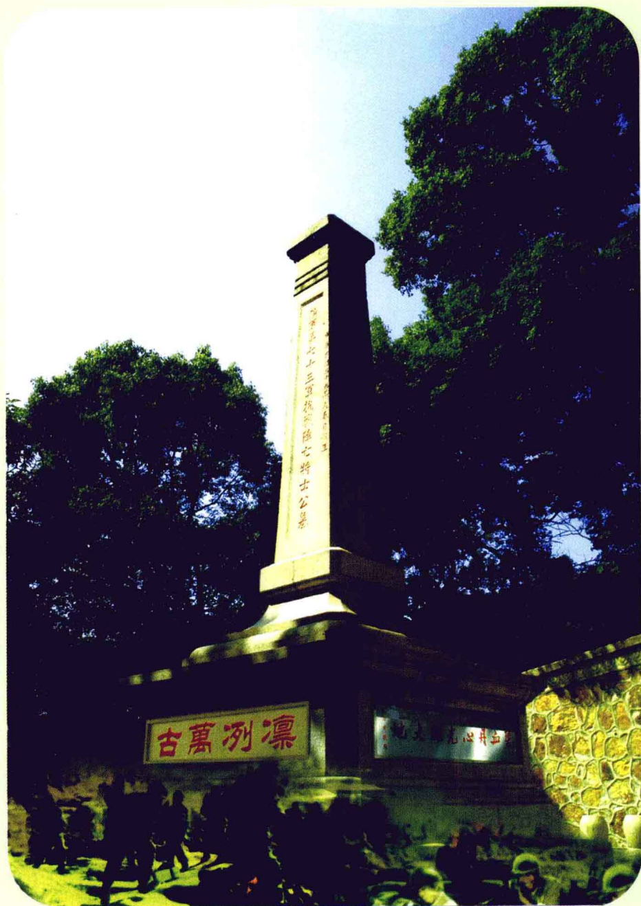
长沙市岳麓山七十三军抗战阵亡将士公墓