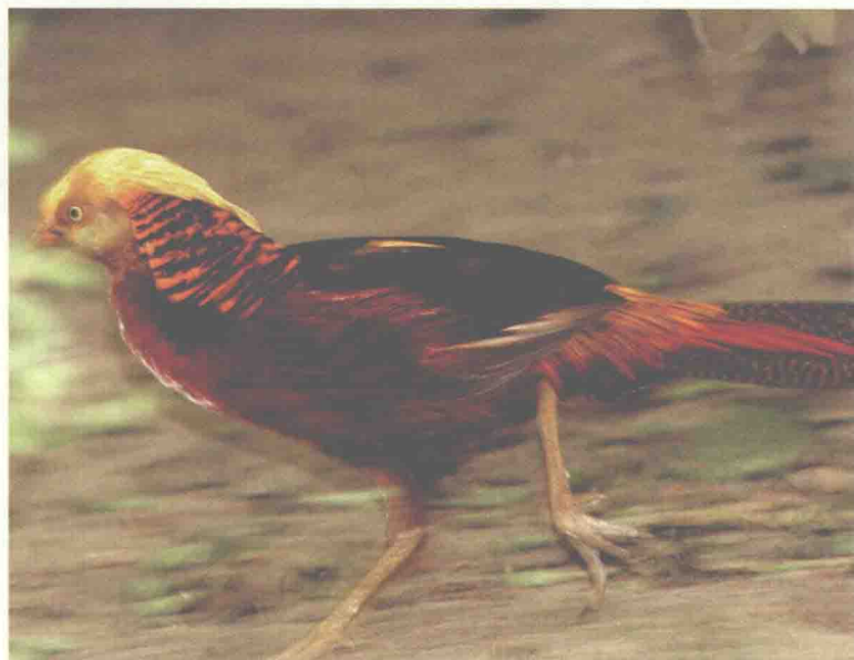
(上) 在树林中奔跑的锦鸡。