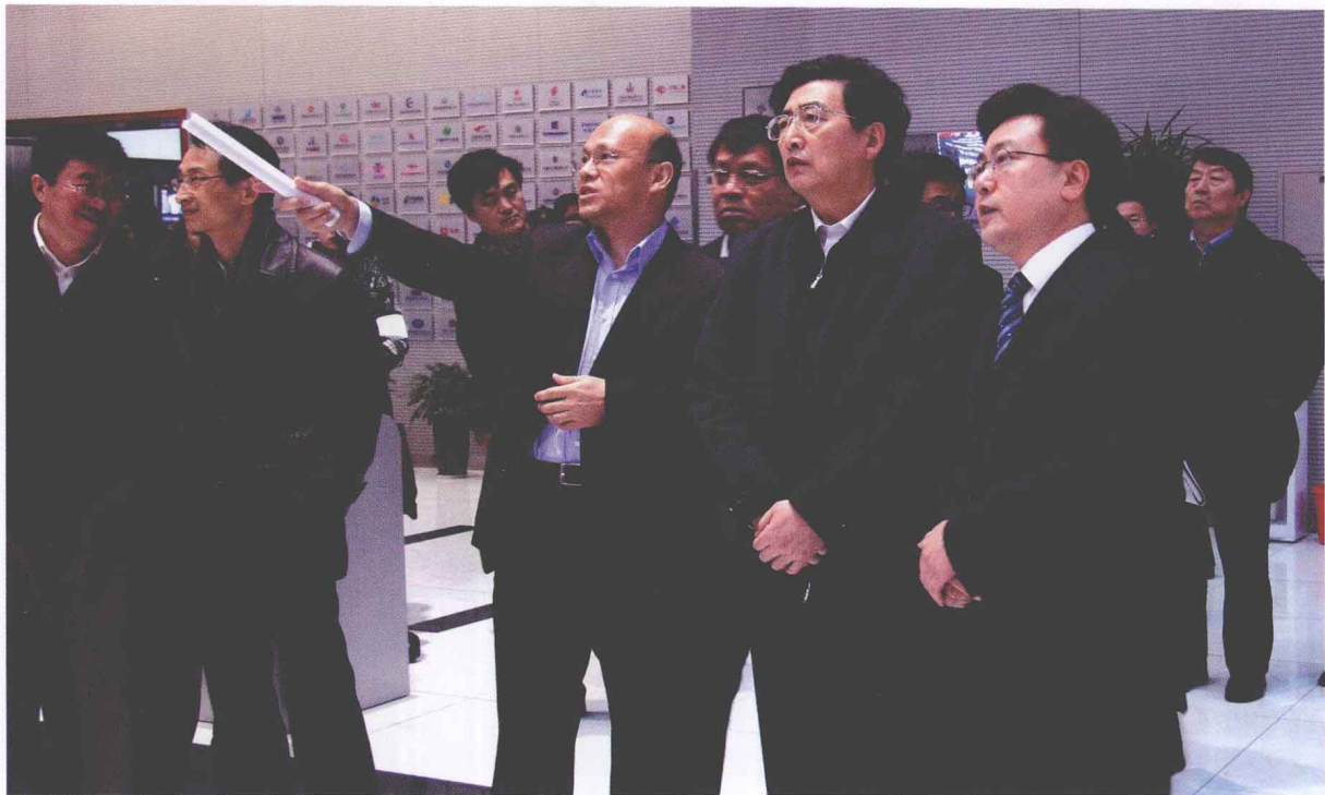
2008年11月28日，北京市市长郭金龙（前排右二）视察北京产权交易所。