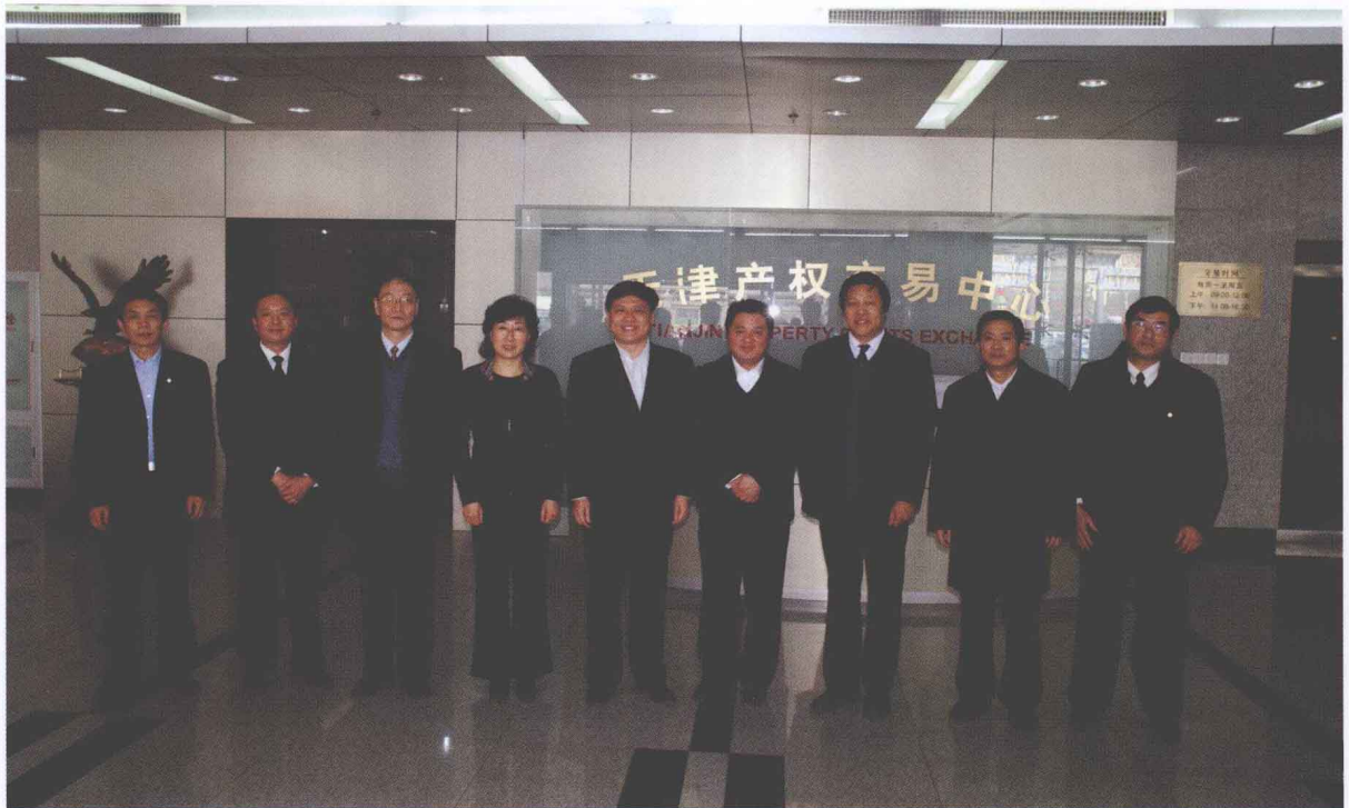
2009年3月8日，安徽省副省长倪发科(右四)等一行到天津产权交易中心考察调研。