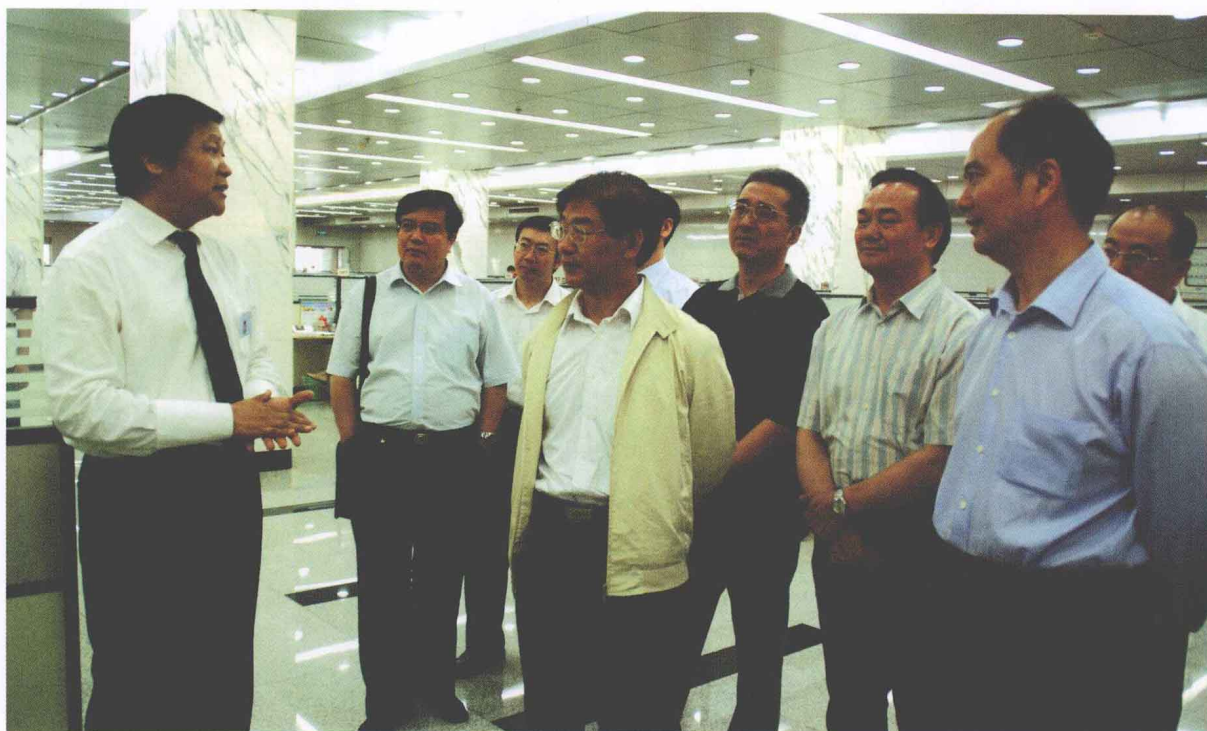
2008年6月4日，国务院国资委纪委书记贾福兴（中）到天津产权交易中心考察调研。