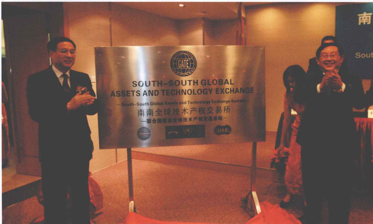
2008年11月3日，南南全球技术产权交易所举行揭牌仪式。国家科技部部长万钢（右）与上海市政协主席冯国勤（左）共同为南南全球技术产权交易所揭牌。