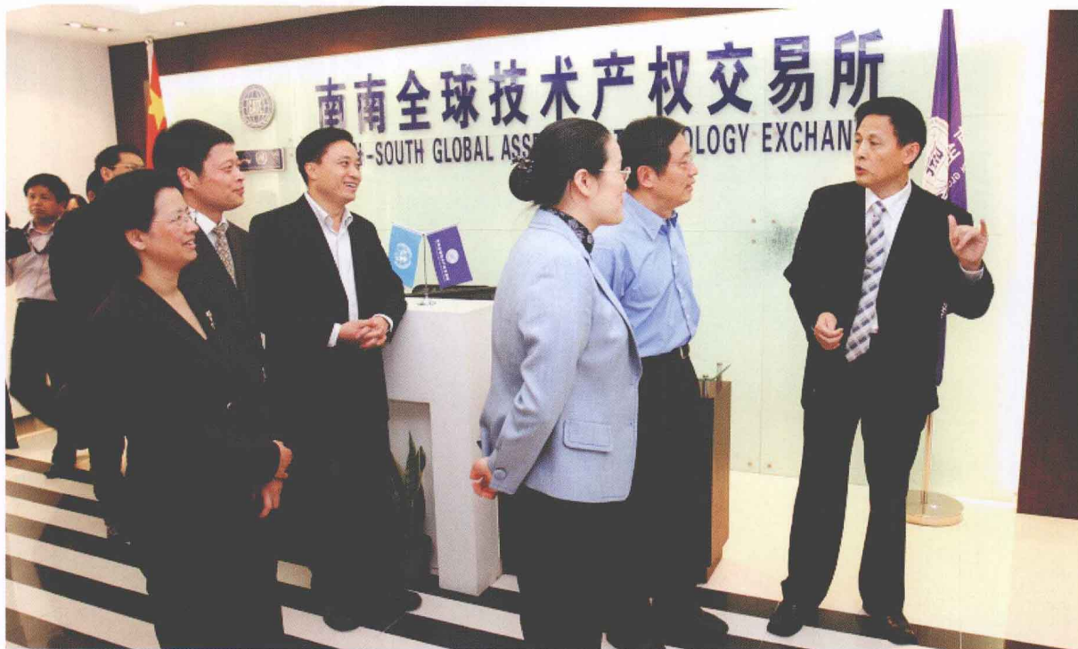
2009年5月21日，上海市副市长屠光绍（右二）、副市长赵雯（右三）等一行到南南全球技术产权交易所视察。