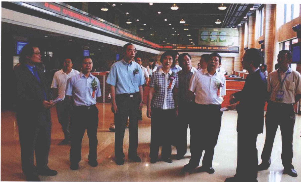
2009年6月14日，上海市常务副市长杨雄（右三）、上海市人大常委会副主任杨定华（前排左四）等一行到上海环境能源交易所视察指导工作。