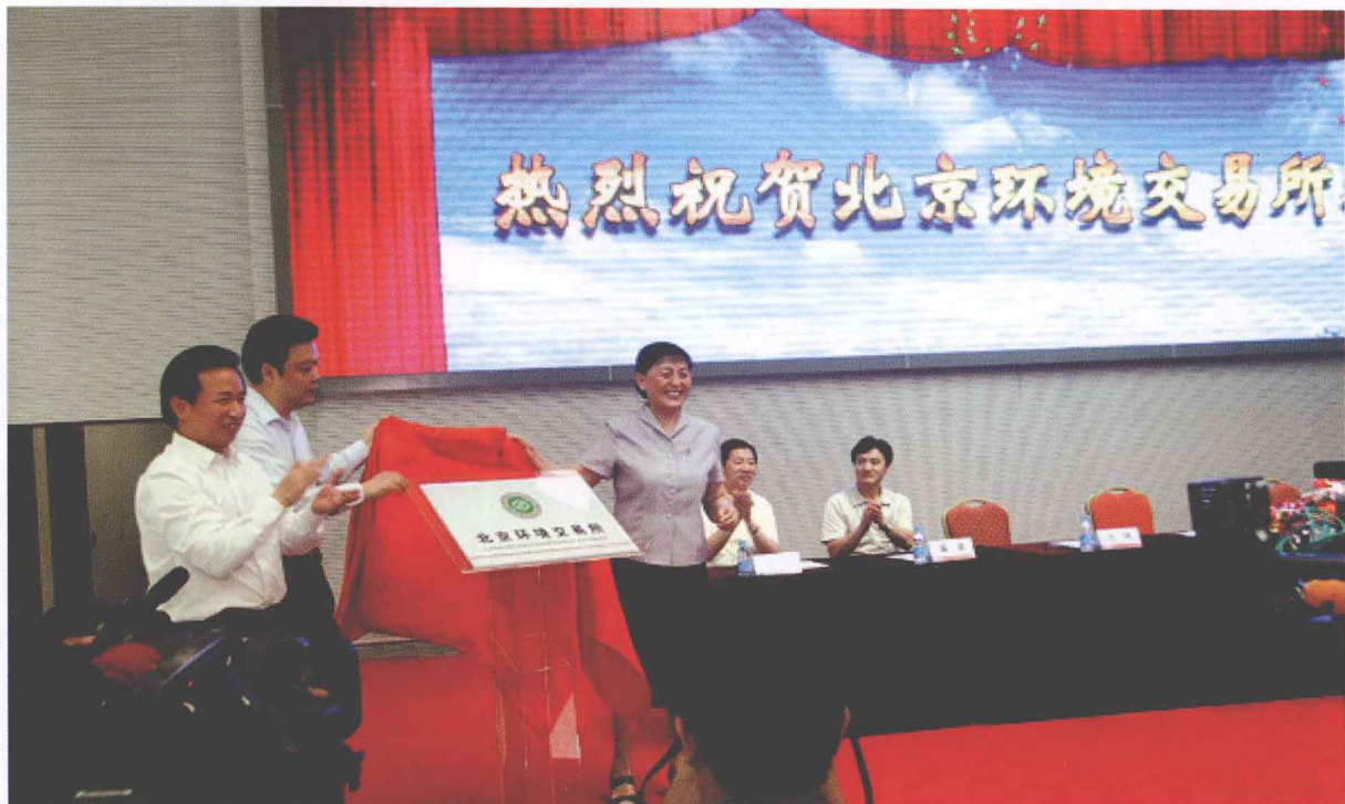
2008年8月5日，北京环境交易所正式挂牌。全国政协副主席张梅颖、环境保护部副部长李干杰、北京市常务副市长吉林等领导出席揭牌仪式。