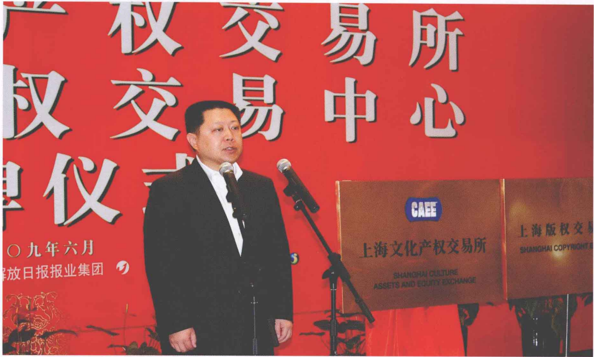
2009年6月15日，由上海联合产权交易所、解放日报报业集团、上海精文投资公司联合投资创立的上海文化产权交易所正式揭牌，这是国内首家成立的文化产权交易所。中共上海市委常委、市委宣传部部长王仲伟出席揭牌仪式并致辞。