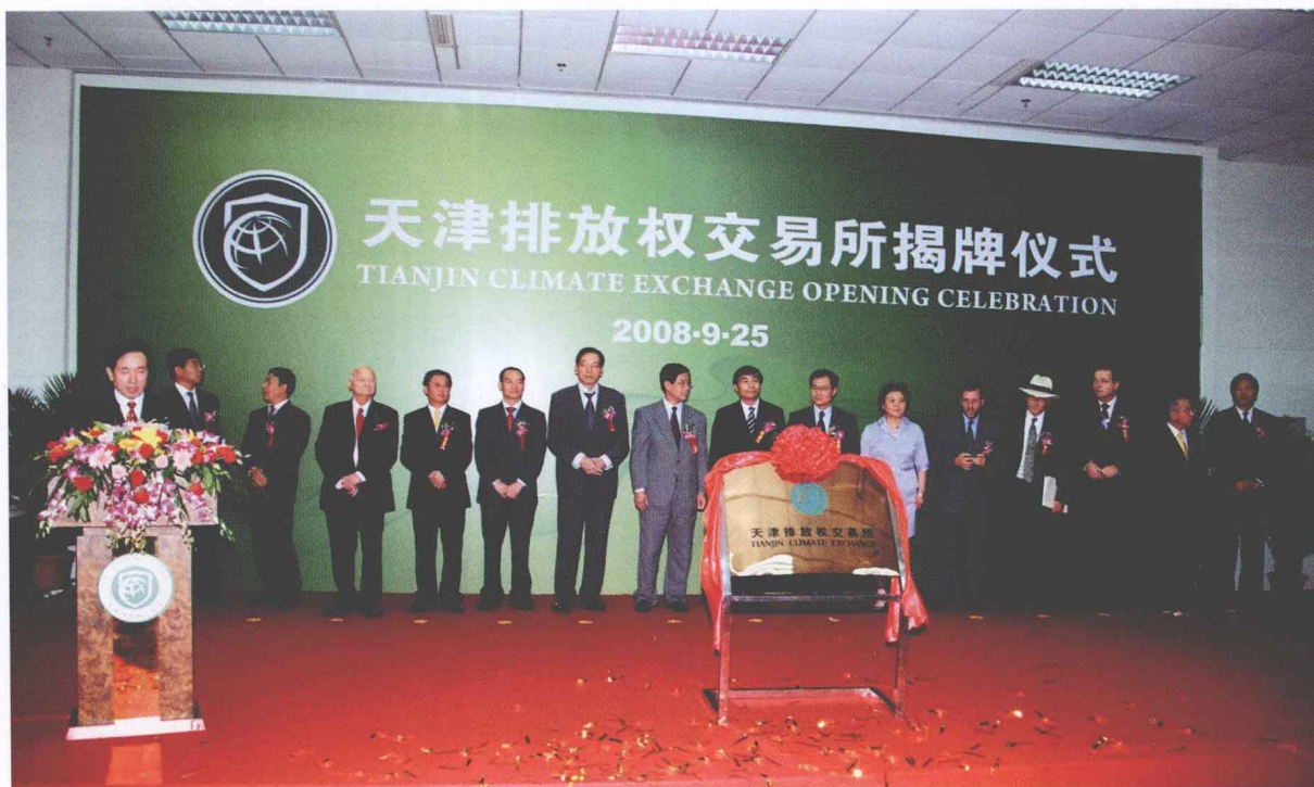
2008年9月27日，天津排放权交易所举行揭牌仪式。中共天津市委常委、副市长崔津渡等领导出席揭牌仪式。