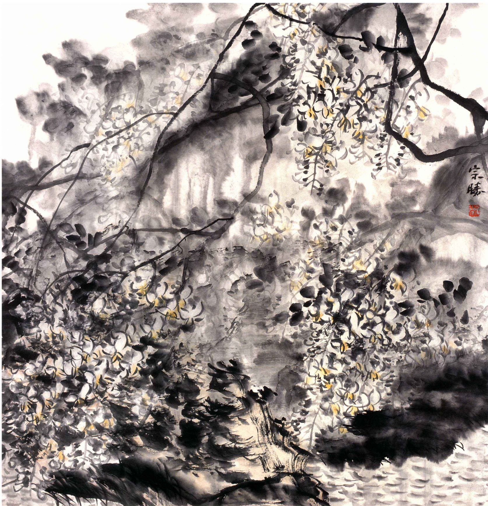
幽谷春深 68cm x 68cm