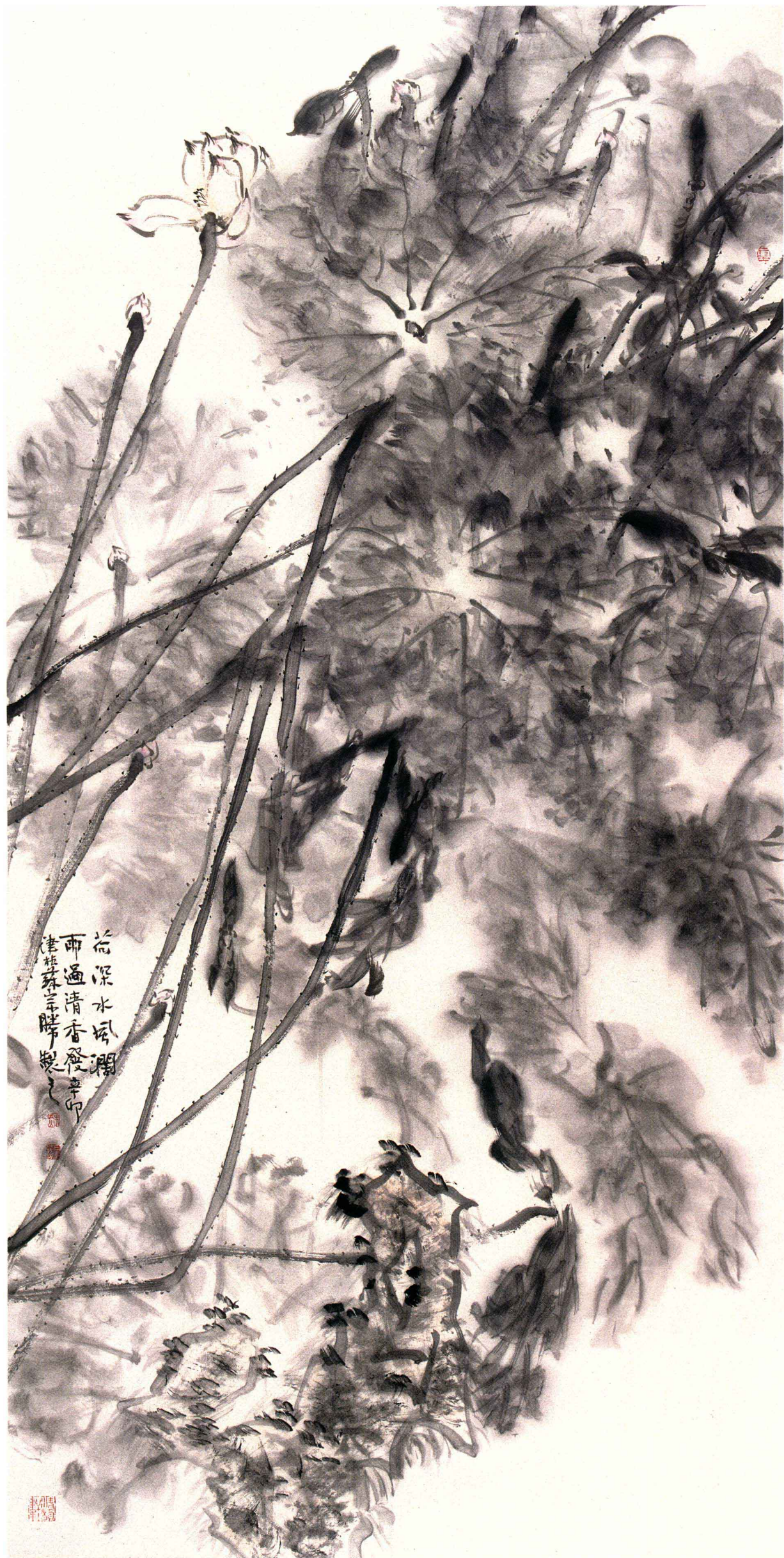
雨过清香发 136cm x 68cm