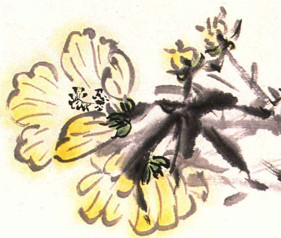
清韵 28cm × 86cm