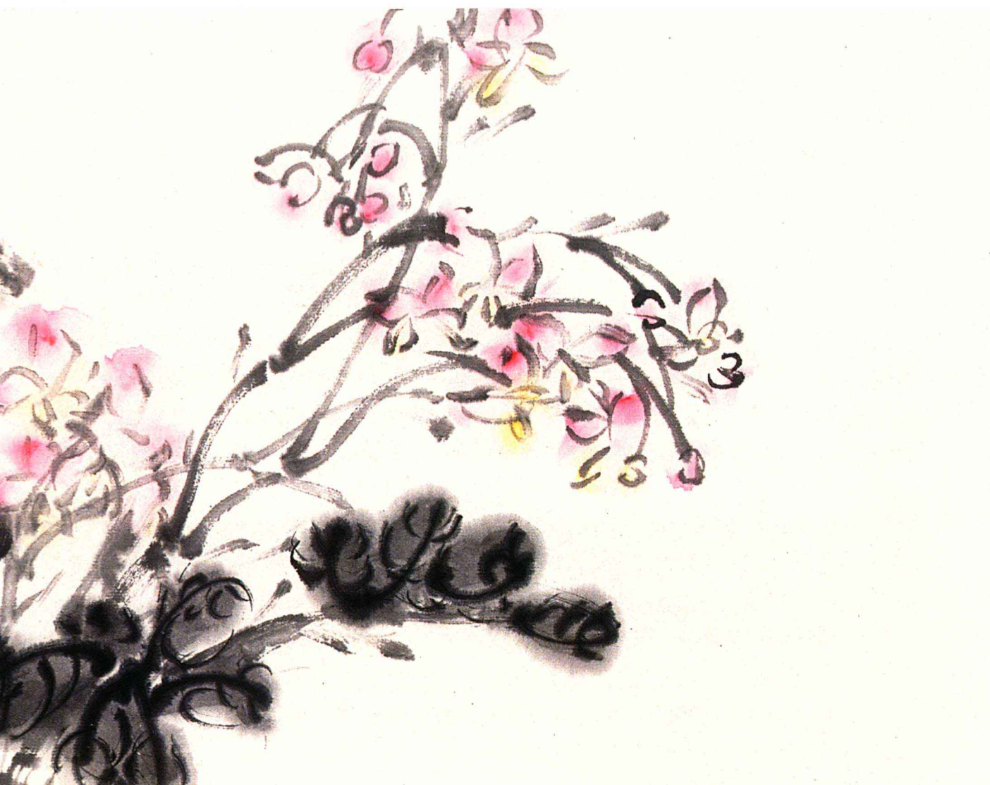
多彩 28cm × 86cm