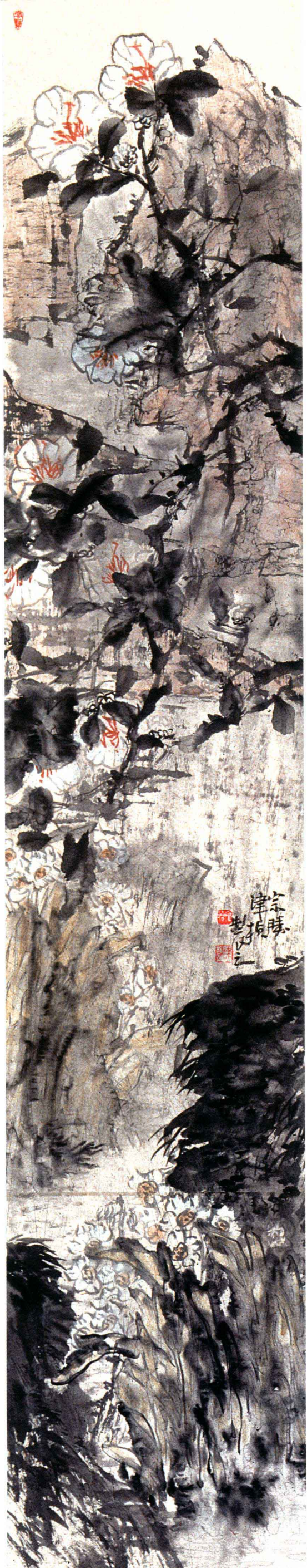
春消息 180cm x 40cm