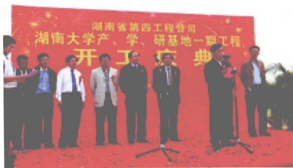
“湖南大学产学研基地”一期工程正式动工。