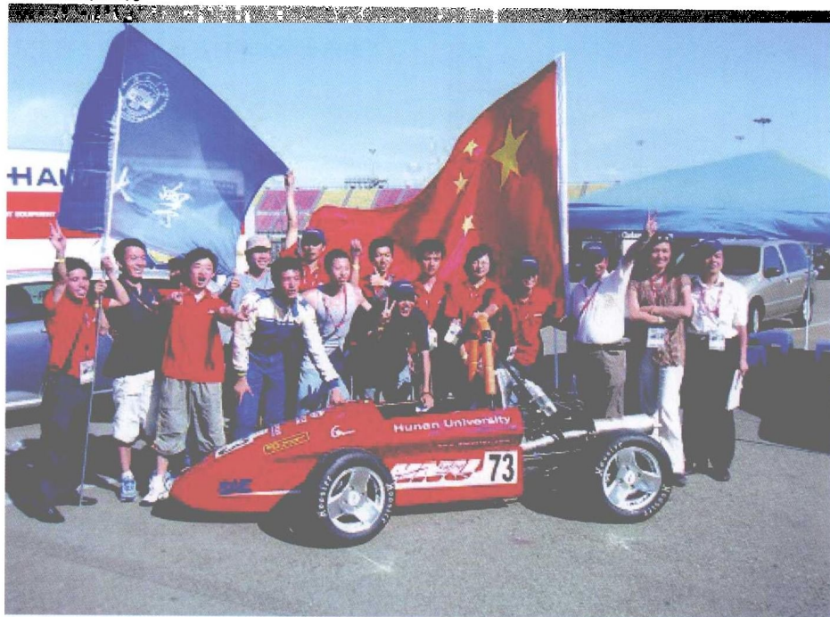
我校代表队出征美国汽车工程协会方程式系列赛。