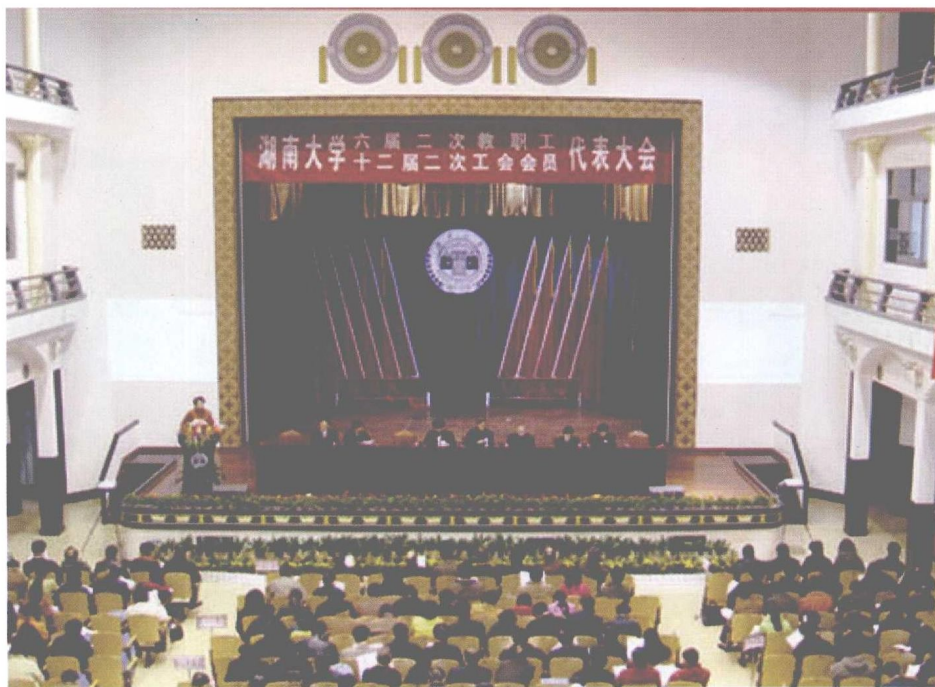
湖南大学六届二次教职工暨十二届二次工会会员代表大会召开。