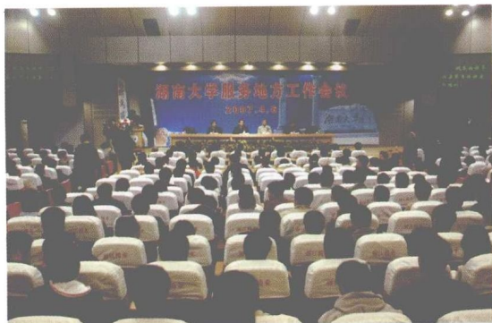
服务地方工作会议召开。