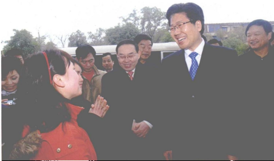
农历大年初一，湖南省委书记、省人大常委会主任张春贤和省领导梅克保、于来山、陈润儿一道，来到我校亲切看望慰问留校的大学生们。