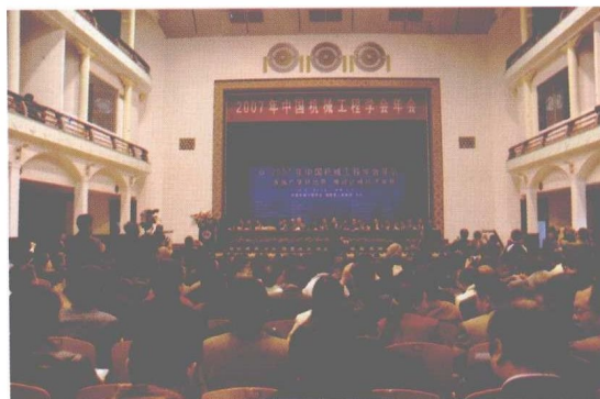
2007年中国机械工程学会年会在我校开幕。