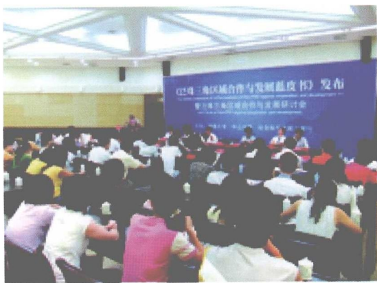
《2007年：泛珠三角区域合作与发展蓝皮书》发布暨泛珠三角区域合作与发展研讨会在我校举行。