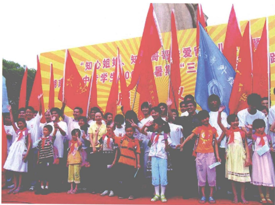
“知心姐姐、知心哥哥关爱留守儿童”暨2007年暑期“三下乡”社会实践活动启动仪式。