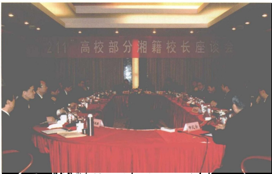
来自省外“211”高校的部分湘籍校长座谈联谊会由我校承办，湖南省委副书记、省长周强和省领导许云昭、郭开朗等出席了座谈会。