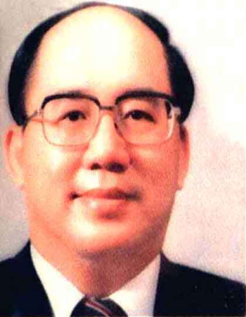
■吳伯雄（中華佛光總會總會長）