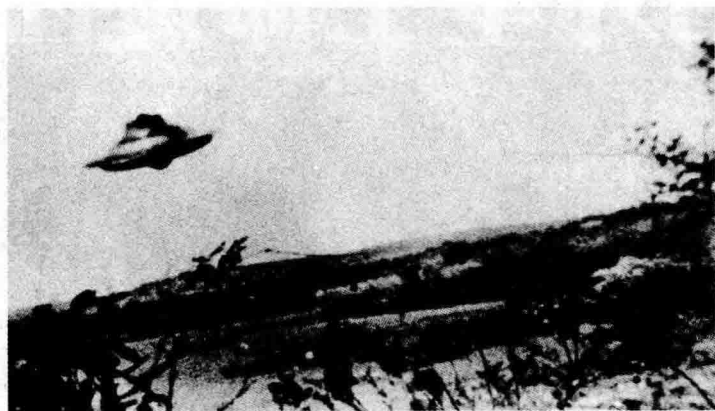
这张拥有经典外观的 UFO 照片拍摄于 1967 年美国罗得州。

随着 UFO 目击事件的日益增多，人类也尝试着想与之较量一番，但是在几次的较量中都以人类的失败而结束。1956 年 10 月 8 日，一个 UFO 出现在日本冲绳