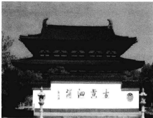
鹿苑镇西的古黄泗浦遗址

大云寺出家，26岁时已是学识渊博、声名远播的律宗大师了。他曾五次尝试东渡日本弘扬佛法，由于海上风浪、触礁、沉船、人员伤亡以及某些地方官员